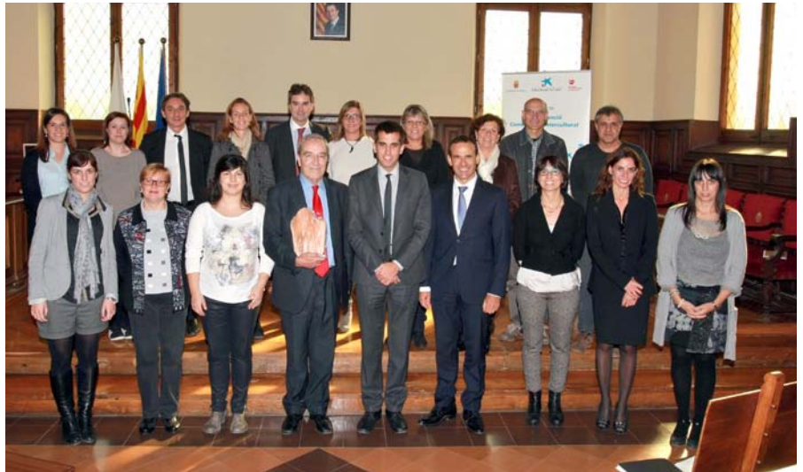
Foto de grup dels impulsors del Programa ICI a Cardona

El Projecte ICI comptarà, també, amb la participació de Càritas i Creu Roja