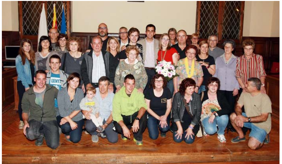
Foto de grup amb els campions cardonins