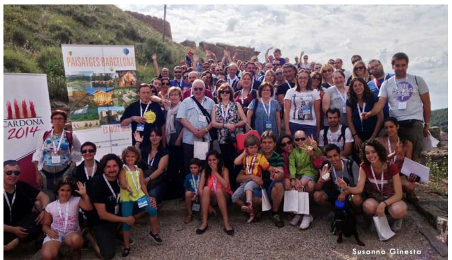
Foto de grup dels participants a la trobada d'Instagrammers