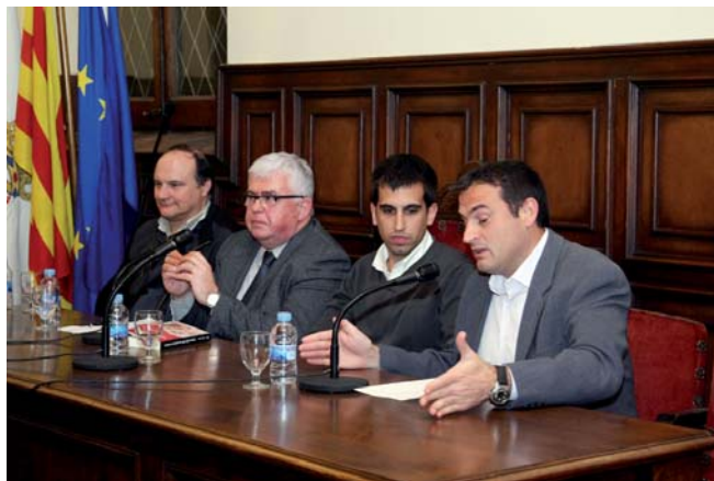
Acte de presentació del llibre "Cardona 1705-1714. La resistència a l'interior"