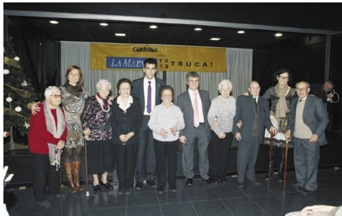
Homenatge a la gent gran de Cardona

El passat dia 1 d'octubre, l'Ajuntament de Cardona, la Residència Sant Jaume i l'Associació "A viure que són dos dies" del Casal de la Gent Gran de Cardona van celebrar el Dia Internacional de la Gent Gran amb l'organització d'activitats de música, cultura i salut.