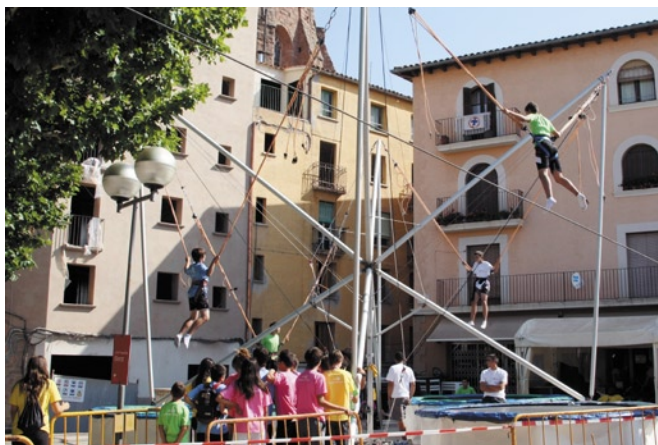
La plaça de la Fira es va omplir d’activitats per a joves de totes les edats