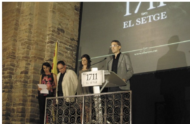
Els autors del documental en l'acte de presentació a la col·legiata

Durant diverses setmanes, el castell de Cardona, el nucli antic i alguns dels entorns del municipi van ser l'escenari del rodatge del documental que combina les escenes de recreació amb les intervencions de diversos especialistes. Al llarg de l'audiovisual es donen les claus de la victòria que els defensors del castell van aconseguir contra l'exèrcit de Felip V. El documental es pot veure a internet accedint a la pàgina web de TV3 a la carta.