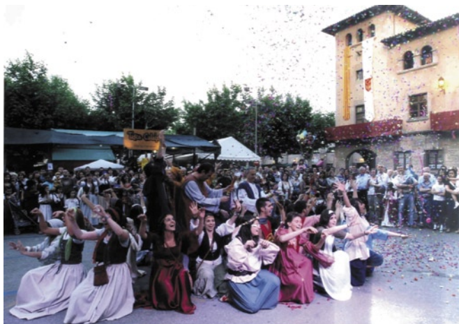
El grup de teatre El Traspunt va participar a la Fira Medieval