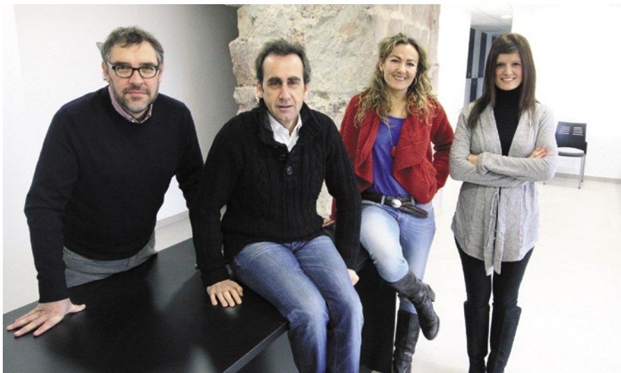
Responsables de l'associació Goral, Centre d'Iniciatives Cardonines

L'objectiu és despertar l'interès per l'emprenedoria des d'edats ben joves i proveir els joves d'instruments que garanteixen canvis actitudinals davant el seu futur professional i vital, contemplant l'emprenedoria com una opció molt sòlida i real. La metodologia seguida és eminentment pràctica i els participants 'fan empresa' adequada a la seva edat. El mètode ha estat desenvolupat i contrastat per la Fundació Junior Achievement durant diverses dècades a molts paï-