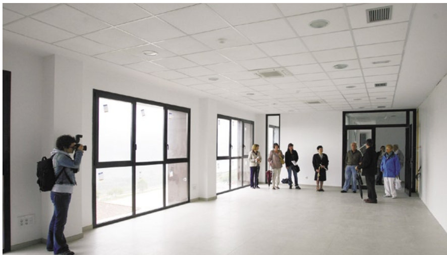
La sala polivalent del Centre Cívic durant unes jornades de portes obertes amb la ciutadania

La voluntat de l'equip de govern és obrir un debat ampli i consensuat amb la ciutadania per tal que el Centre Cívic respongui el millor possible a les necessitats de les entitats i els veïns. En aquest sentit, l'executiu municipal espera que el procés tingui la màxima implicació