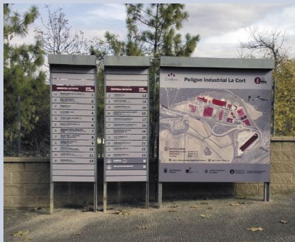
Els nous plafons s'han instal·lat a l'entrada del polígon La Cort

El Projecte de senyalització ha estat possible gràcies al conveni de col·laboració signat per l'Ajuntament de Cardona i el Consell Comarcal del Bages, així com a l'impuls de l'Associació d'Empresaris de Cardona (AEC) que també ha assessorat en els continguts informatius.