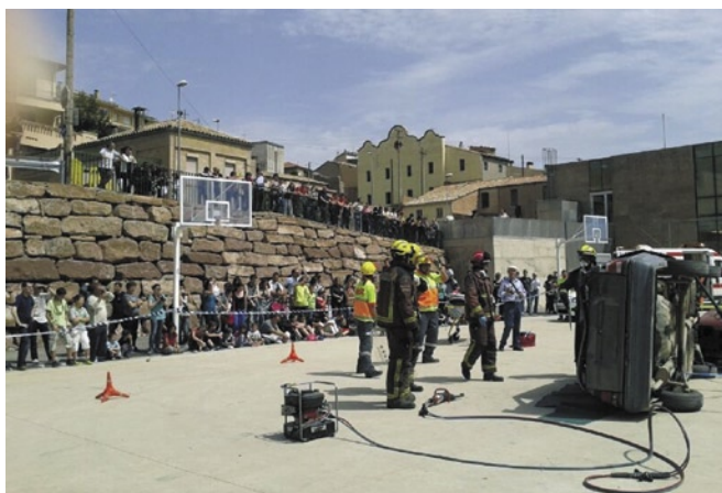
Simulació d'un accident de trànsit per part dels Bombers, el SEM, Creu Roja i el Traspunt

A través d'aquest nou canal de comunicació, Cardona disposa d'una nova eina, pràctica i ràpida, per difondre de manera actualitzada les recomanacions i els consells de seguretat de protecció civil en casos d'emergències com nevades, incendis, onades de calor, etc. La web es complementa amb informació sobre l'associació i els serveis que presten a la ciutadania