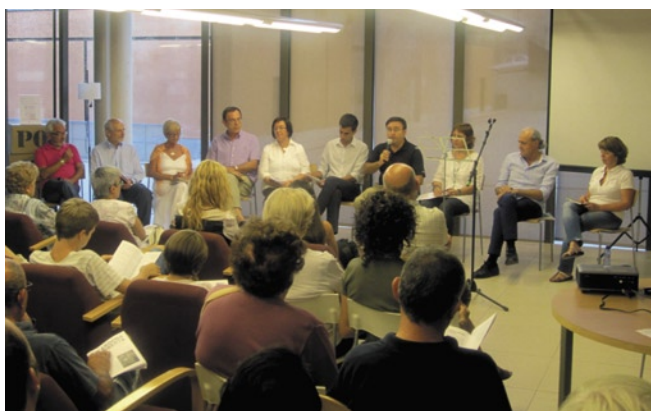
La biblioteca municipal va acollir l'acte d'homenatge a la poesia cardonina