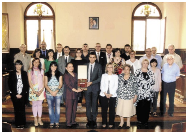
Entrega del Saler d'Or a la Unió de Botiguers i Comerciants de Cardona