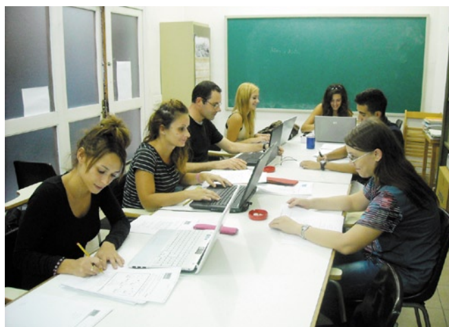
Imatge d'alguns dels alumnes de l'Escola de Formació d'Adults de Cardona

L'Ajuntament de Cardona va acollir els mesos d'agost i setembre un nou curs de formació en prevenció de riscos laborals destinat al sector agrari. El curs el van impartir els tècnics Joves Agricultors i Ramaders de Catalunya (JARC) i estava homologat pel Departament d'Agricultura de la Generalitat de Catalunya.