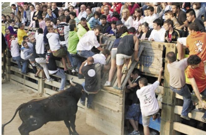
El Corre de Bou continua sent un dels actes més multitudinaris de Festa Major