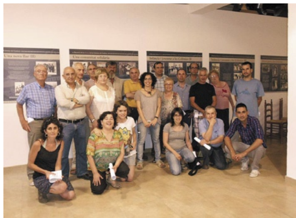
Imatge de grup dels participants al taller d'història

Les activitats del primer bloc van començar la setmana del 14 de gener i inclouen un taller de restauració de mobles i altres objectes que imparteix Màrius Codina, un de cuina per a sorprendre a càrrec de David Guitart, un sobre el món de l'òpera amb Ovidi Cobacho, un de