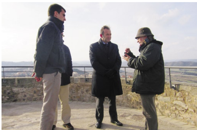
Miquel Calçada, comissari de la Generalitat per als actes del 2014, en una visita recent a Cardona

Aquest nou projecte, impulsat per l'Ajuntament cardoní, hauria de veure la llum l'any 2014 i ja ha començat a caminar gràcies a les gestions realitzades per l'Ajuntament. De moment, l'alcalde ha mantingut diverses reunions amb els representants de Cultura de la Generalitat, del Museu d'Història de Catalunya i amb el comissionat de la Generalitat per als actes de commemoració del 300 aniversari de 1714, per començar a treballar en el projecte.