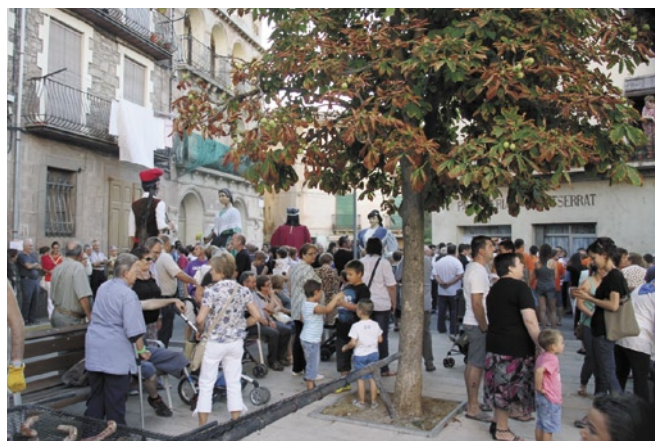
La Festa Major de la Coromina 2012 va ser molt participada

La companyia la Cua del Gat va representar l'obra de teatre "Arsénico por Compasión", seguidament Bruixes de Cardona va obrir la festa amb un correfoc en companyia dels Laietans. Els grups Revoltijo, Laietans, Strombers, Crystal, Trifàsic, la Faràndula i Charly Music van amenitzar els concerts i els balls de nit. També van participar a la festa la Banda de Música de Cardona, els geganters i la Cobla de