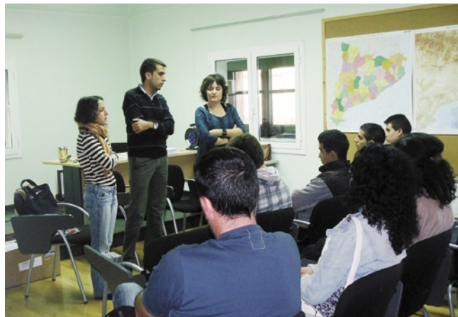
El curs d'accés als Cicles Formatius de Grau Mitjà ha omplert tota les places disponibles

L'Escola d'Adults de l'Ajuntament de Cardona va començar el passat mes d'octubre un nou curs escolar amb un total de 103 alumnes matriculats, la xifra més alta d'alumnes que registra l'escola des de l'any 1985, quan es va posar en funcionament.