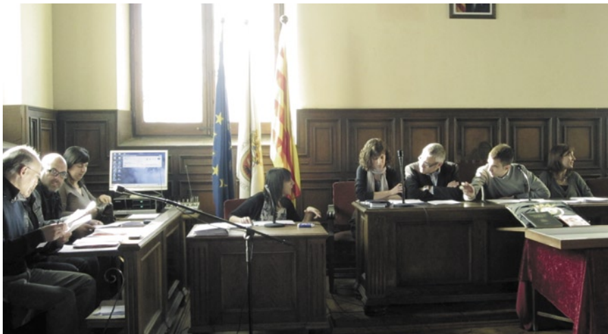
Imatge d'arxiu d'un ple de l'Ajuntament de Cardona

El Pla de pagament a proveïdors va permetre a l'Ajuntament abonar durant el passat mes de juny un total de 920 factures per un import d'1,7 milions d'euros corresponents a factures pendents de pagament