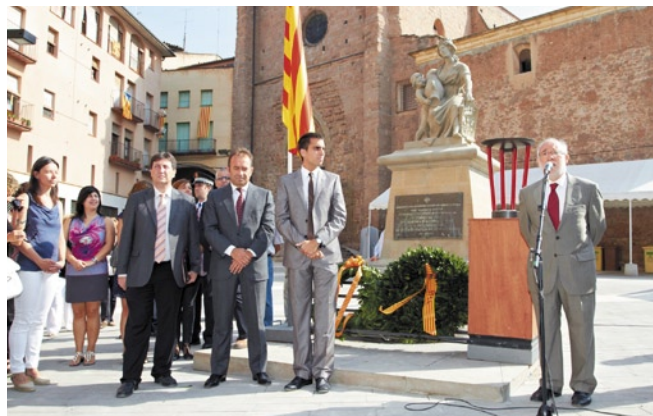
Acte de commemoració de la Diada

del 300 aniversari del 1714, el qual va pronunciar una conferència al saló de sessions i posteriorment va assistir als actes de commemoració de la Diada del dia 10 de setembre. Pel que fa a la resta d'actes, aquests van seguir el format tradicional amb "l'Encierro" de dissabte com a punt d'inici de les festes, el trasllat de la imatge de la Mare de Déu del Patrocini, la Trobada de Gegants i els Corre de bou de dissabte, diumenge i dilluns.