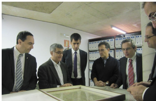
La delegació barcelonina va visitar el Casal Graells