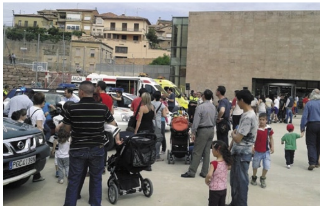
Els actes de la Trobada d'Emergències van ser seguits per un públic nombrós de petits i grans

Van participar-hi la Policia local, els Mossos d'Esquadra, els