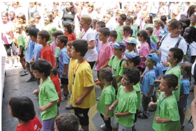
L’activitat física va ser un dels principals atractius de la 3a jornada de salut de la Fundació SHE

Sota el lema “Toquem el cel amb la mà”, la jornada va aplegar més de 400 nens i nenes de Cardona que van participar en les nombroses activitats organitzades. Des de bon matí la plaça de la Fira es va omplir d’activitat amb la instal·lació de diversos jocs com un circuit multiaventura, un rocòdrom, una tirolina i diversos llits elàstics o jumpings i quatre globus aerostàtics captius que s’enlairaven des del camp de futbol, el castell i la plaça de la Fira. També hi va haver un taller de castells a càrrec dels Castellers de Vilafranca