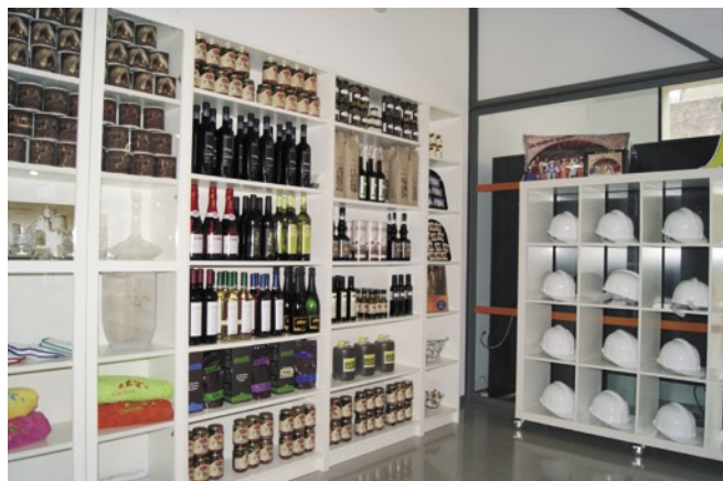
"La Botigueta" s'ha ubicat a la recepció d'entrada del Parc Cultural de la Muntanya de Sal

Els visitants hi podran trobar nous articles de marxandatge i promoció com llibretes, punts de llibre, llapis, magnets i tasses amb la imatge promocional de Cardona, samarretes originals i divertides i objectes d'artesanía. L'oferta comercial d'aquest nou espai es complementa amb una selecció de vins de la DO Pla de Bages i de la finca Llobet de Cardona, a més de cafès de la vila, olis i productes "gourmet" fabricats a la zona del Cardener. La botiga també disposa d'una completa col·lecció de llibres i publicacions relacionats amb el patrimoni històric, cultural i natural de la vila i un espai dedicat especialment