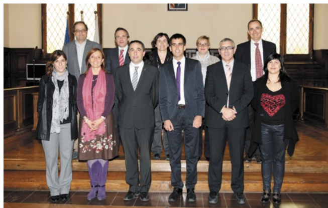
La corporació municipal amb el tinent d'alcalde de Cultura de l'Ajuntament de Barcelona, Jaume Ciurana

Per la seva banda, el tinent d'alcalde de Cultura de Barcelona, Jaume Ciurana, va començar el seu parlament destacant "el respecte i l'admiració" que Barcelona sent per la vila de Cardona. "El 18 de setembre de 1714 -va explicar Ciurana- Cardona va saber estar a l'alçada de les circumstàncies i va fer de capital del país, mostrant una