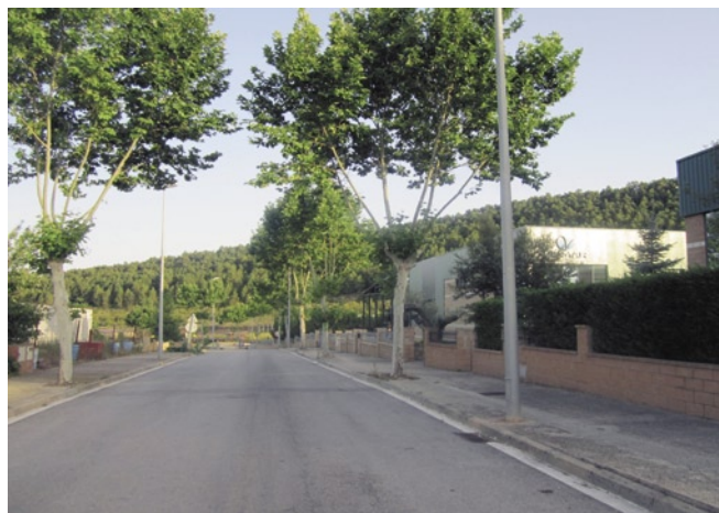
L'Ajuntament vol implantar la fibra òptica al polígon

Aquest estudi permetrà conèixer la situació actual del polígon pel que fa a les connexions de banda ampla i serà el primer pas per definir les característiques de la futura xarxa de fibra òptica que s'hi haurà de desplegar. L'estudi està finançat íntegrament per la Diputació de Barcelona