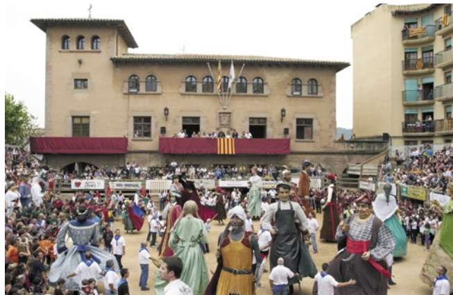
La Trobada de Gegants va convocar un públic molt nombrós