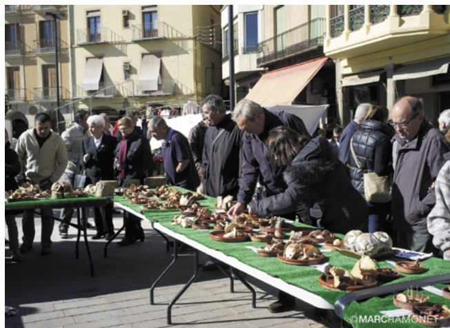
La Fira de la Llenega manté el seu poder de convocatòria

Durant tot el dia la vila es va omplir de visitants que, a més de comprar a les parades de venda de bolets i productes artesanals, van poder gaudir de degustacions de plats cuinats amb bolets elaborats per 10 restaurants de la vila, participar en concursos i activitats culturals i contemplar l'exposició de diferents varietats de bolets. Enguany la Fira estrenava un nou concurs, el de tapes fetes amb bolets, i com ja és habitual comptava amb la participació de les botigues de la Unió de Botiguers i Comerciants de Cardona que van posar les seves parades al carrer. La Fira de la Llenega 2012 va programar també una exhibició de ball country, un concert dels alumnes de l'Escola Municipal de Música Musicant a l'església parroquial i una botifarrada popular diumenge al vespre a la plaça Mercat. Com cada any, la Fira de la Llenega programa el festival Tocats del bolet, dedicat especialment als més joves.