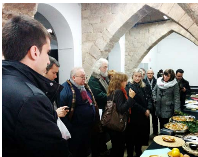
Presentació dels plats d'hivern de la cuina de 1714