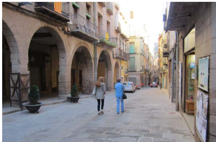
L'Ajuntament vol reduir la pressió fiscal sobre les famílies

Pel que fa a les llicències de construccions, obres i serveis, mantenen les bonificacions a la rehabilitació de façanes i