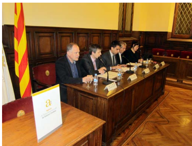
Imatge de la presentació de l'Agència al saló de sessions de l'Ajuntament

Els ajuntaments i les associacions empresarials de Solsona i Cardona impulsen aquest projecte pioner per a la dinamització econòmica