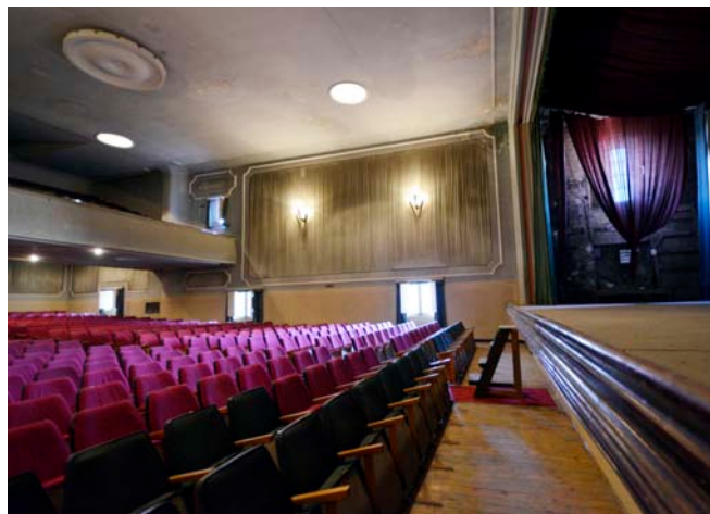
Imatge actual de l'interior del Cine Modern

Així mateix, l'adquisició del local permetrà que altres activitats artístiques, escèniques i espectacles culturals, tant de petit com de gran format, es puguin representar a Cardona. L'òrgan gestor del nou centre de convencions serà la Fundació Cardona Històrica que haurà de modificar la seva