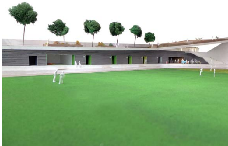
Simulació del futur camp de vida activa de Cardona

La segona fase contempla l'estabilització del terreny per tal de donar suport a tota l'àrea que habitualment tenia problemes d'esfondrament. Durant aquesta fase es faran dos tipus d'actuacions, una que consistirà a col·locar uns pilots de formigó que serviran per fixar els terrenys de l'angle sud-est