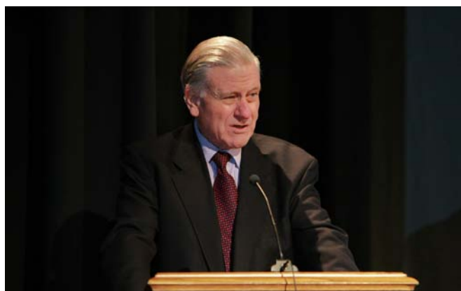
El Dr. Valentí Fuster va demanar la confiança i l'esforç de tots els cardonins per fer de Cardona un referent mundial de vila saludable

les característiques d'un projecte que suposarà una inversió de més d'un milió d'euros per a Cardona. Prèviament a la presentació pública del projecte, el saló de sessions de l'Ajuntament va acollir una reunió de tots els grups municipals amb el Dr. Valentí Fuster.