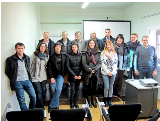
Fotografia de grup de l'equip de treball de l'Agència