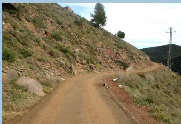
El camí Nou presenta un aspecte totalment renovat

A hores d'ara està pendent la incorporació de baranes en alguns dels trams, l'enjardinament i la instal·lació del parc urbà de salut. La ubicació tant dels equipa-