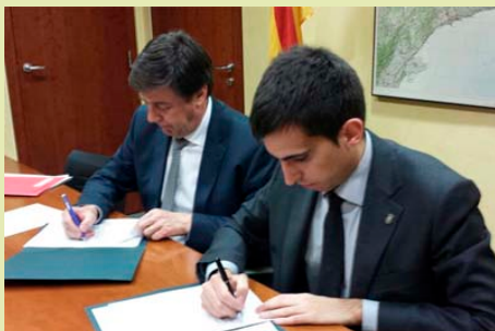
L'alcalde de Cardona i el director de l'ACA durant la signatura del conveni, acompanyats de la regidora i els representants veïnals i dels regants de la Coromina