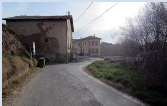
Imatge del tram de camí que es repararà

En aquest punt està previst col·locar un nou paviment asfàltic als primers 100 metres aproximadament de camí que hi ha just després del pont i que en l'actualitat es troben en força mal estat.