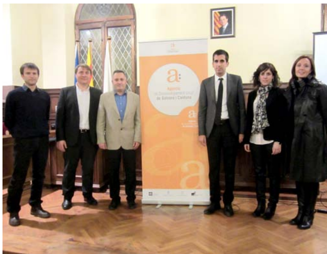
El saló de sessions de l'Ajuntament va acollir l'acte de signatura del conveni

Per impulsar les mesures fixades en el conveni, l'Agència i l'empresa Cardonaplast treballaran coordinadament per facilitar la cobertura de llocs de treball tècnics i qualificats en l'estructura laboral de l'empresa. També desenvoluparan accions d'intermediació amb la comunitat educativa per proposar processos formatius adaptats a les necessitats d'ocupació de l'empresa.