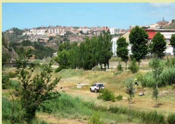
El conveni permetrà executar les obres de recuperació del valor mediambiental del meandre de la Coromina

L'Ajuntament s'encarregarà, per tant, de l'obtenció de tots els terrenys i permisos necessaris per a