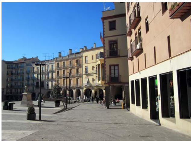
L'Ajuntament vol incentivar l'arribada de nous habitants

Així, els ajuts que es prestaran tenen un import màxim de 150 euros mensual durant un període màxim de 8 mesos i són una primera mesura per fomentar l'accés a la vivenda dels joves i les persones nouvingudes que s'empadronin a la vila.