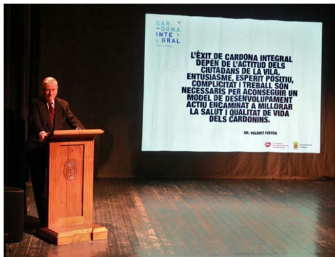
El Dr. Valentí Fuster adreçant-se al públic que omplia el teatre Els Catòlics