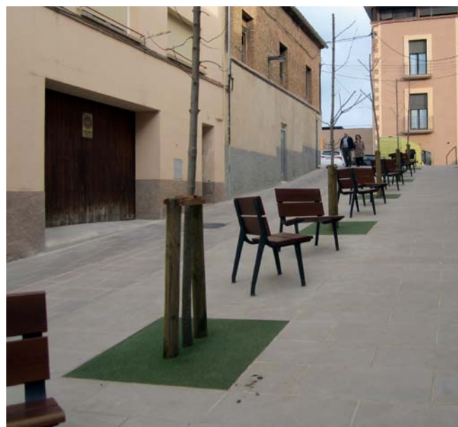
Imatge del carrer Hospital després de les obres de reforma

També s'han millorat les instal·lacions aèries de la xarxa elèctrica existent. D'aquesta manera, s'ha dut a terme la substitució del cablejat elèctric amb suports metàl·lics per un cable trenat fixat a les façanes i s'han soterrat els creuaments del carrer. El mateix procés s'ha fet pel que fa a la xarxa de telèfons i de televisió per cable. Tots els treballs que s'han fet al subsòl s'han realitzat sota control arqueològic.