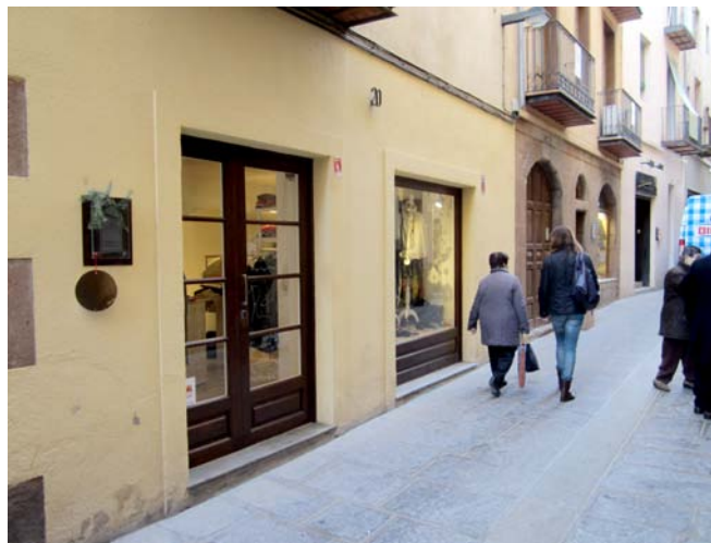
L'Ajuntament impulsa la creació de noves activitats econòmiques i fomenta l'impuls a l'emprenedoria

La valoració que l'equip de govern fa del projecte és molt positiva "com ho demostra el fet que cada any s'hi acu-