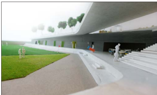
El camp de vida activa és una de les actuacions del projecte Cardona Integral que es beneficiarà de l'acord subscrit entre la Diputació de Barcelona i l'Ajuntament

finalment, les autoritats van visitar el Cine Modern, que ha d'acollir el futur centre de convencions de la vila.