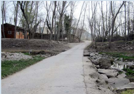
Es restituirà el formigó de la palanca del riu Cardener

Els treballs que s'hi preveuen realitzar afecten el tram de camí que va des de la cruïlla amb la C-55 fins al límit del terme municipal i tenen un pressupost de 50.120 euros. Entre les actuacions que s'hi portaran a terme hi ha l'anivellament i el formigonat de l'accés al camí des de la cruïlla amb la C-55 i la restitució del paviment de la palanca del riu Cardener de la qual es repararà la vora i se'n senyalitzarà els límits. El projecte de millora preveu també la pavimentació amb formigó de l'accés al pont de Sant Salvador i la