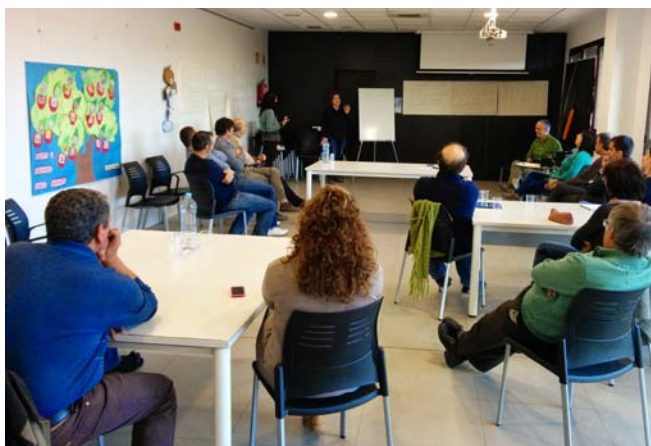
El Centre Cívic va acollir les sessions sobre el projecte Cardona Verda

Al llarg de diversos mesos de treball s'ha dut a terme un intens procés participatiu amb tots els implicats, des dels veïns de la Coromi-