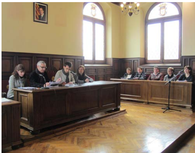
Imatge del Ple municipal de l'Ajuntament de Cardona

Per contra, l'executiu municipal reforça l'Àrea de Promoció Econòmica, que incrementa els seus recursos un 5%, amb un total de 138.201 euros de pressupost. També augmenta en 5.000 euros la dotació del Pla local de serveis a les perso-