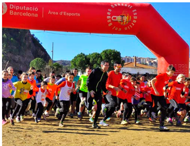
Imatges de la sortida del Cross escolar

La jornada va ser un èxit i va comptar amb la col.laboració de les AMPA de totes les escoles de Cardona, Policia Local, Protecció Civil, Creu Roja, dinamitzadors dels centres educatius, Consell Esportiu del Bages i el Club de Futbol de Cardona.