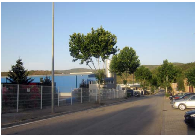
L'Agència de Desenvolupament Local de Solsona i Cardona desenvoluparà i executarà el Programa de dinamització dels polígons industrials

Per dur a terme aquest programa de dinamització, s'està treballant amb les empreses dels polígons per conèixer les seves necessitats i identificar les millores que necessiten aquests equipaments en aspectes com les telecomunicacions o la gestió de residus. A més, els tècnics de l'Agència i l'Ajuntament