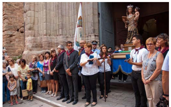
La corporació municipal a l'entrada del temple de Sant Miquel