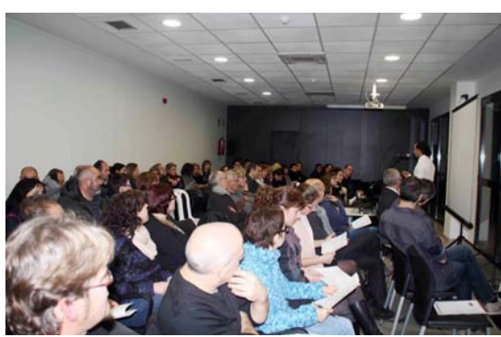
Imatge d'una de les sessions del Pla estratègic