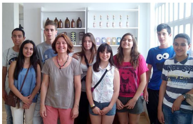
Els joves guanyadors del concurs en una de les visites

Els 2 equips guanyadors, Muffins and Tea -guanyadors de la categoria Before- i Sabons Bombolles -guanyadors de la categoria After- van visitar AINEA, dedicada a la fabricació de sabons naturals, fragàncies i olis essencials. També van visitar els Espais Jubany per conèixer aquest projecte gastronòmic basat en la cuina de qualitat. El divendres 27 de juny, l'equip dels Muffins and Tea va anar a visitar l'empresa Frit Ravich i l'equip de Sabons Bombolles va participar en la cinquena edició del Fòrum Impulsa, organitzat per la Fundació Príncep de Girona, per fomentar i conscienciar sobre la necessitat d'invertir en educació. La Fira del Jove Emprenedor és una iniciativa de l'entitat cardonina Goral Centre d'Inicatives Cardonines amb la col.laboració de l'Ajuntament de Cardo-