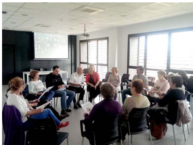
El grup de suport emocional es reuneix al Centre Cívic de Cardona

La creació d'aquest grup de suport emocional i ajuda mútua ha estat possible gràcies a la sol·licitud de l'ajut que els Serveis Socials de Cardona van fer a la Diputació de Barcelona en el marc del catàleg de serveis 2014.