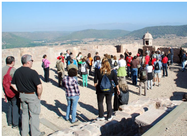
Imatge d'una de les visites que realitza la FCH al castell de Cardona

L'augment de les visites coincideix amb l'any del Tricentenari que va situar la vila de Cardona com un dels centres de referència d'aquesta commemoració. En aquest sentit, durant l'any 2014, la FCH i l'Ajuntament de Cardona van dur a terme diverses accions de promoció turística de la vila com la creació d'un nou fulletó turístic del qual s'han editat 30.000 exemplars. També s'ha promocionat una visita a Cardona des de Barcelona i s'ha fet una àmplia campanya publicitària en diversos mitjans de comunicació com RAC1,