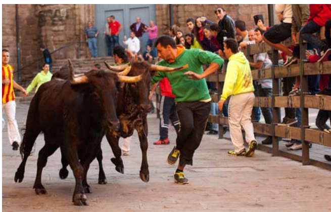
Imatge de l'Encierro del dilluns de Festa Major

Els actes de dissabte van prosseguir al migdia amb l'espectacle infantil de Jaume Barri. El trasllat de la imatge de la Mare de Déu del Patrocini amb les actuacions del Ball de bastons i el ball de l'Àliga van ser els principals actes de la tarda, amb el Corre de bou tradicional i la cercavila nocturna de Gegants. Els actes van continuar amb el concert sopar DFT-Aston i el ball de Festa Major amb Supernova al passeig de la Fira. Diumenge al matí Cardona es va omplir de gegants amb la Trobada Gegantera que, en aquesta ocasió, va comptar amb els gegants i l'Àliga de Barcelona. Després de l'ofici solemne i el Corre de bou infantil amb la Penya Les Barreres, els gegants van recórrer els diferents carrers del centre històric