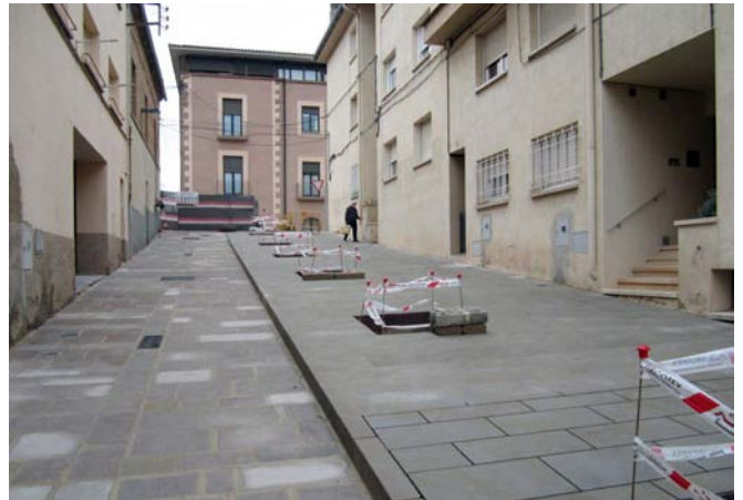
Imatge de les obres que s'estan duent a terme al carrer Hospital

Les obres de remodelació han tingut un pressupost de 182.282,84 euros que s'han finançat a través d'un ajut de la Diputació de Barcelona, de recursos propis de l'Ajuntament i de les contribucions especials dels veïns del carrer Hospital i d'un tram del carrer del Pujolet.