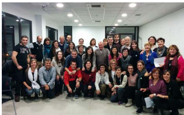
Fotografia de grup dels participants al curs de promotors de salut