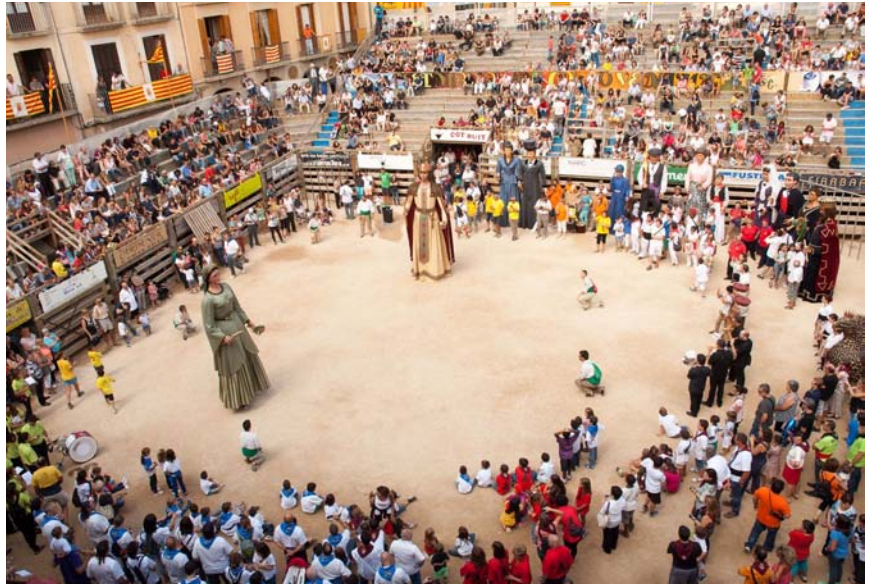
La Trobada de Gegants va ser un dels actes més participats de la Festa Major 2014

La nit abans, la festa es va apoderar de la plaça de bous amb la celebració de la "Nit de l'Empalme" i el pregó popular que enguany va protagonitzar la cantant