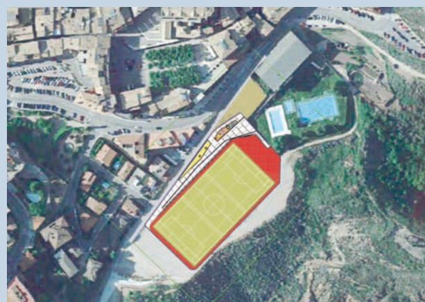
Imatge del projecte del Camp de Vida Activa