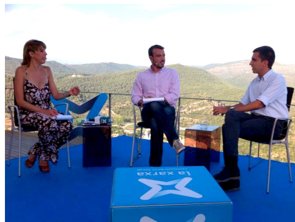
L'alcalde de Cardona durant l'entrevista que li van fer al programa

Per altra banda, la col·legiata de Sant Vicenç del castell va ser l'escenari del programa especial que la Xarxa de Televisions Locals ha dedicat aquest any al Tricentenari de la fi de la Guerra de Successió. El programa es va estrenar el 10 de setembre amb un capítol especial gravat a la col·legiata de Sant Vicenç en el qual van