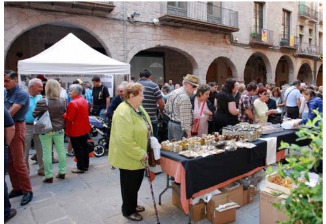
La Fira de la Llenega 2014 va registrar una gran aflluència de públic

Però el plat fort de la Fira van ser els bolets que enguany comptaven amb una desena de parades especialitzades. Durant tota la jornada l'animació a la plaça de la Fira i a la plaça Mercat no va minvar, amb un gran nombre de visitants que gaudien de la Fira. Un any més, el comerç local va participar a la Fira traient les parades al carrer, a iniciativa de la Unió de Botiguers i Comerciants. Entre els al·licients