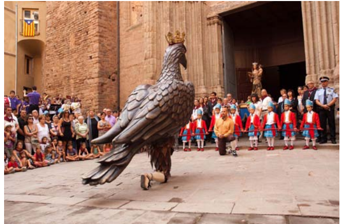
L'Àliga de Cardona ballant a la plaça Mercat

Dilluns va començar amb una nova tancada de bous i, seguidament, l'ofici religiós amb el ball de l'Àliga a l'interior del temple. Després es va fer el Corre de bou infantil amb la Penya El Calaixó i, ja a la tarda, la cercavila de Calaixons i el Corre de bou. Al vespre va actuar la Cobla de Cardona a la