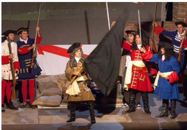
Imatge de la recreació històrica "Viurem lliures o morirem"

En el marc dels actes del XVII Aplec de Cardona va tenir lloc la recreació de l'arribada de 'l'últim correu' des de Sallent fins a Cardona. Diversos genets a cavall i amb indumentària