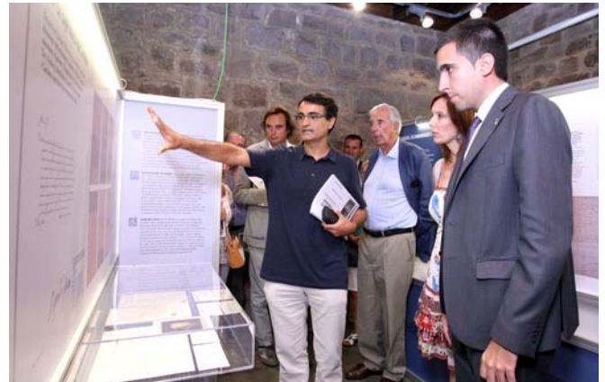
Les autoritats davant la vitrina que guardava el document original de les capitulacions de Cardona