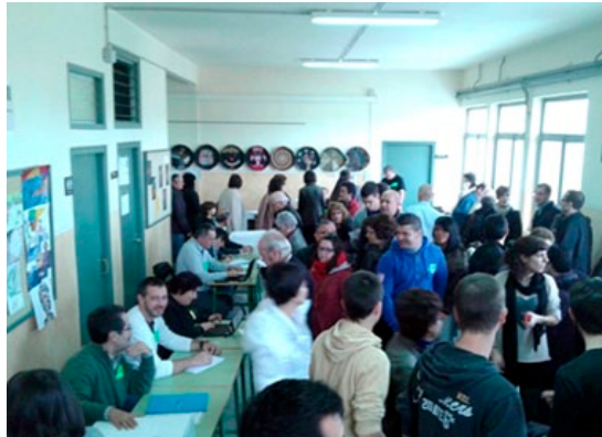
Imatge del col·legi electoral del 9N

El procés participatiu sobre el futur polític de Catalunya, celebrat el 9 de novembre a tot el país, va deixar a Cardona una destacada xifra de participació amb un total de 2.122 votants. Una dada força significativa si es compara amb la participació a les darreres eleccions municipals en les quals van anar a votar 2.717 persones. Dels vots comptabilitzats, 1.669 (el 78,6%) van optar per l'opció del Sí-Sí, el Sí-No va recollir 192