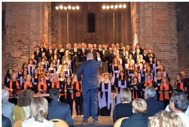
La Coral Cardonina va participar al concert de l'Orfeó Català

El concert es va desenvolupar en dues parts, una primera dedicada especialment a la música religiosa i una segona part que va repassar algunes de les composicions més conegudes i celebrades del repertori de la música tradicional i popular