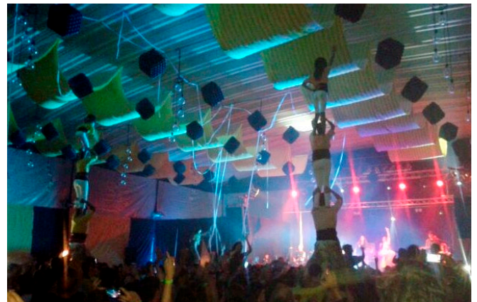
L'envelat de la Festa Major de la Coromina ple a vessar

Altres activitats de les festes van ser el cafè-concert del grup Cybee, la representació, a càrrec de la companyia de teatre La Cua del Gat, de l'obra "Doña Rosita la soltera o el lenguaje de las flores". Les activitats adreçades als més joves també van gaudir d'una alta participació en especial el passacarrers i l'animació infantil. Dissabte a la tarda es va celebrar el pregó de festes, la tronada de Festa Major i el gran ball a l'envelat amb el conjunt Solimar. Diumenge hi va haver un nou passacarrers amb la Banda de Música de Cardona i sardanes amb la Cobla de Cardona, i després del Piromusical es va celebrar el gran ball de Festa Major, amb l'orquestra