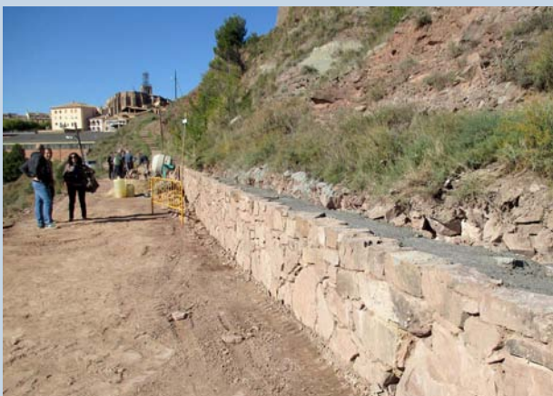
Fotografia de les obres del camí Nou

També s'ha fet la tria d'aparells que formaran el parc urbà de salut, que estarà situat al Parc del camí Nou, i que facilitaran tant la mobilitat com l'entrenament cardiovascular, amb elements dirigits a públics de totes les edats. Pel que fa al Camp de Vida Activa, el projecte executiu ja ha estat presentat a l'Ajuntament i s'està ultimant el calendari per tal de començar les obres.