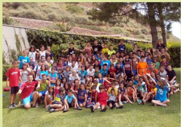
Foto de grup dels monitors i els nois i noies del Casal Multiesportiu

Enguany, el Casal Multiesportiu estrenava una nova activitat, el FutbolNet. Un programa d'educació en valors a través de l'esport creat per la Fundació FC Barcelona. El programa FutbolNet forma part del projecte Cardona Integral que promouen l'Ajuntament i