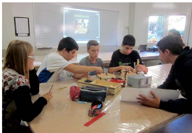
Un moment del taller de foment de l'emprenedoria

Els alumnes es van repartir en equips de treball i, a partir d'una problemàtica plantejada inicialment, van dissenyar i construir una proposta de solució. Un cop definida la proposta, la van defensar davant de la resta de la classe. El curs el