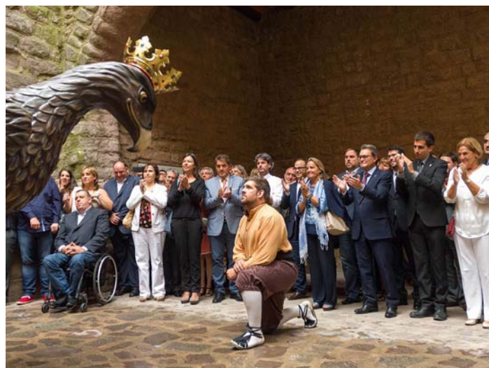
L'Àliga de Cardona va ballar davant de les autoritats

L'acte de cloenda del Tricentenari de Cardona va finalitzar a l'exterior de la col·legiata amb el ball de l'Àliga de Cardona. Representant la vila cardonina, l'Àliga va ballar en honor del president Mas i de la presidenta del Parlament, de les autoritats i del poble cardoní. Va ser una ballada excepcional carregada de simbolisme que va arrencar un fort aplaudiment de tots els assistents. Un cop acabada la ballada i amb el pati d'armes del castell ple de gom a gom, la Banda de Música de Cardona va interpretar el Cant dels Segadors donant per finalitzat un dels actes més emotius celebrats a Cardona en els darrers anys.