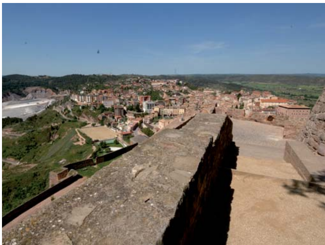
El projecte Cardona Integral, amb la Fundació SHE, serà un nou revulsiu per a la vila de Cardona