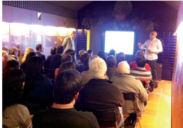
Presentació del Pla de màrqueting al Centre Cardona Medieval

L'empresa responsable del Pla, Advance Leisure Services, durà a terme una campanya enfocada especialment a amplificar la presència de Cardona a les xarxes turístiques i a millorar el seu posicionament a Internet. També ben aviat s'implementarà el sistema de compra de productes online, que permetrà als usuaris planificar per avançat les seves visites a la vila. Amb el nou Pla es posicionarà Cardona als mitjans