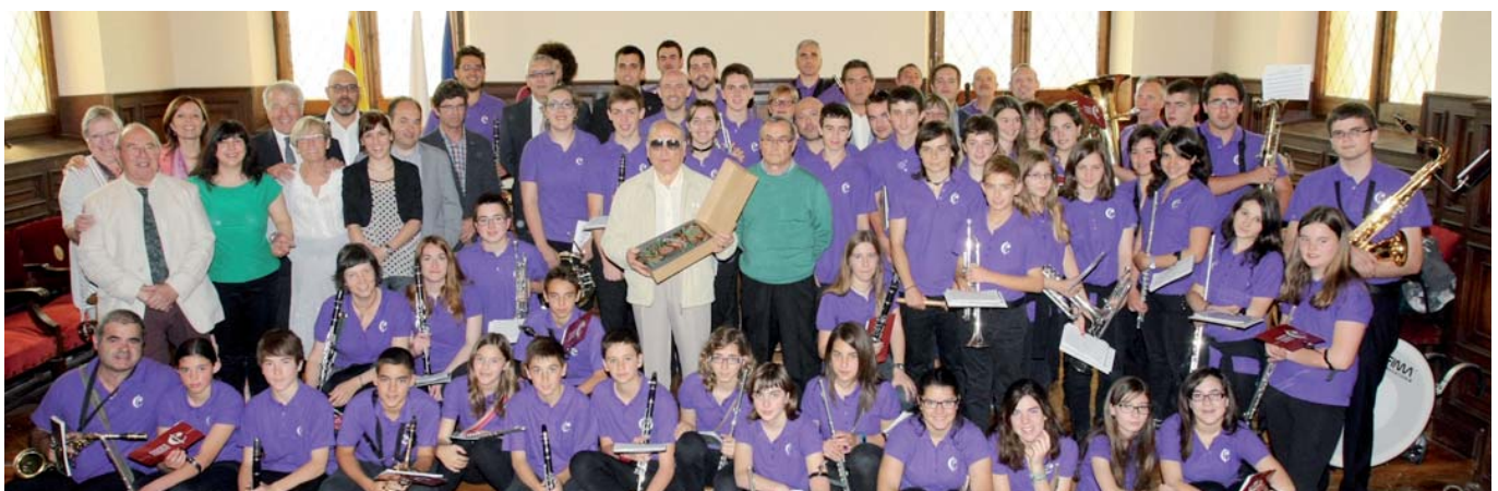
Fotografia de grup de l'Ajuntament i els membres de la Banda de Música de Cardona