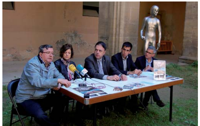
Acte de presentació del conveni entre els ajuntaments de Cardona i Manresa

Per tal de promocionar les dues visites, s'oferirà un preu especial de 4 euros per visitar Cardona i es rebrà un val de descompte per fer la visita "Manresa, ciutat cremada" i vice-