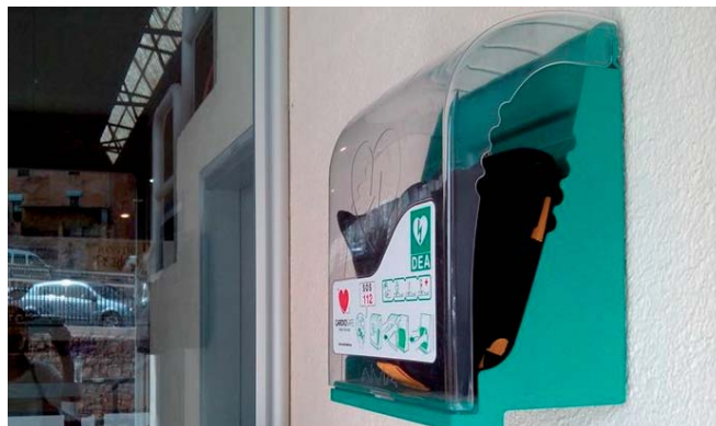
El Pavelló Municipal d'Esports disposa d'un nou aparell de cardioprotecció

El Pavelló Municipal d'Esports disposa, des de principis de juny, d'un nou Desfibril·lador Extern Automàtic (DEA) que se suma a l'altre aparell que l'Ajuntament va instal·lar l'estiu passat a l'edifici consistorial. L'equip de cardioprotecció és portàtil, s'ha instal·lat a l'entrada del pavelló i també donarà servei a les piscines municipals. Coincidint amb l'adquisició del nou DEA, l'Ajuntament va organitzar una sessió formativa sobre el seu funcionament destinada als membres de les entitats esportives de Cardona, tal i com es va fer en el seu moment amb el personal de l'Ajuntament. La sessió la van fer tècnics de la Creu Roja que han assessorat el consistori