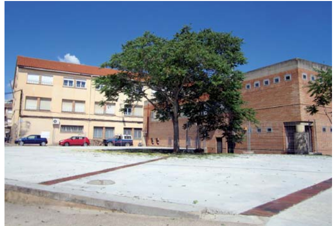
Imatge de la renovada plaça de Josep Compte i Viladomat

Pel que fa a la plaça de Josep Compte i Viladomat, l'actuació que s'hi ha portat a terme ha consistit en la substitució de l'antic ferm de grava i terra per un asfaltat de formigó. A més, s'hi han habilitat 17 noves places d'aparcament, fet que permet augmentar el nombre de places d'estacionament de vehicles en una zona propera al centre històric, cosa que ajudarà a millorar l'accés dels veïns al nucli antic. El projec-