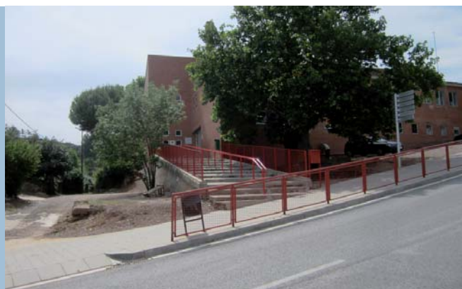
L'Ajuntament ha renovat la barana de l'accés a l'escola Joan de Palà

L'Ajuntament de Cardona ha renovat enguany la barana de les escales d'accés a l'escola Joan de Palà de la Coromina. Els treballs han permès substituir tota l'antiga estructura de les baranes i col·locar una nova barana de ferro i de color vermell.