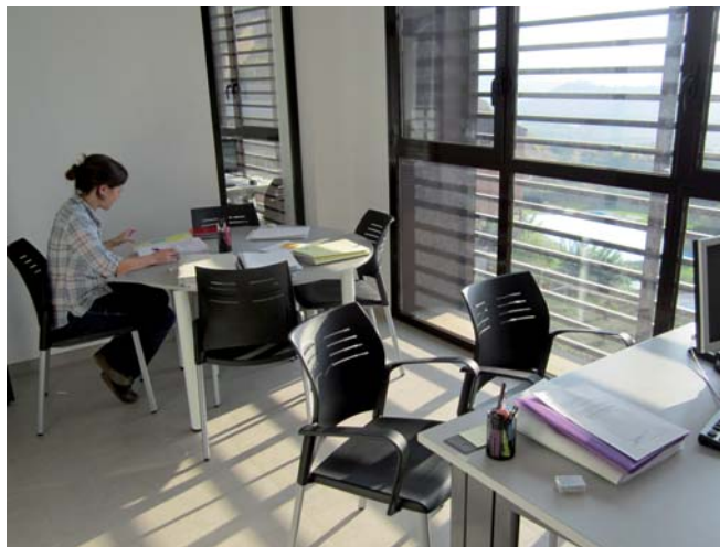
Les oficines dels Serveis Socials, a l'edifici del Centre Cívic

Fins al mes de maig es van aprovar un total de 395 ajuts i els Serveis Socials han prestat ajudes a 50 famílies del municipi amb dificultats econòmiques. L'any passat es van concedir 763 ajuts. Els ajuts es gestionen des dels Serveis Socials i es destinen a cobrir les necessitats bàsiques d'habitatge, transport o educació. Igualment, la Regidoria de Serveis Socials de l'Ajuntament ha posat en marxa un programa de treballs comunitaris que permet a les persones receptors d'ajuts realitzar treballs diversos per a la comunitat.