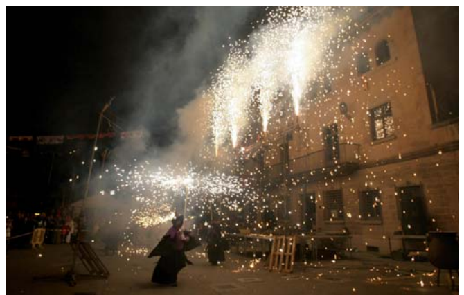
Les Bruixes de Cardona van posar el foc a la Fira Medieval 2014

de la vila de Cardona, distinció que enguany va recaure en la Banda de Música de Cardona, entitat que ha contribuït enormement a preservar i difondre el patrimoni musical de la vila. A continuació es va fer l'acte d'entrega de la moneda-pagament del dret d'Aimines per part de l'empresa Salinera de Cardona.