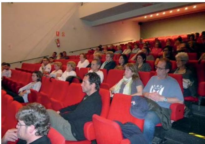
L'acte de presentació del balanç de govern es va fer al teatre Els Catòlics

A més, l'equip de govern està tirant endavant diversos projectes per tal de fent front a la crisi i reactivar l'economia local. Entre aquests, destaquen el Pla de dinamització dels polígons industrials que s'impulsa en col.laboració amb els municipis de Solsona i Olius amb l'objectiu de dinamitzar l'activitat industrial a partir de la col.laboració publicoprivada. També s'ha començat a treballar en la redacció del Pla estratègic de Cardona, “una eina vital per al futur de Cardona que servirà per definir el model econòmic de la vila per als propers anys” i s'ha creat una línia d'ajuts econòmics per a emprenedors que ha contribuït a l'obertura de quinze nous negocis a la vila. El suport a les iniciatives de