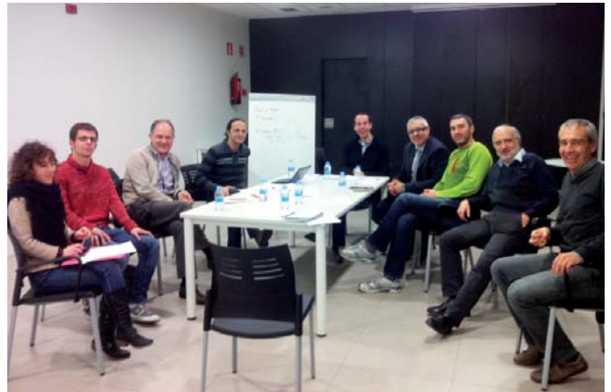
Reunió de la taula sectorial d'Indústria

El passat mes de febrer, l'Ajuntament de Cardona va posar en marxa el projecte de definició del Pla estratègic de la vila, un projecte que vol fixar, a través de la participació ciutadana, les línies estratègiques del desenvolupament econòmic i social de Cardona per als propers anys. Per dur a terme el Pla, l'àrea de Promoció Econòmica de l'Ajuntament ha implementat un procés participatiu que compta amb la implicació de tota la societat cardonina. Per fer-ho, s'han creat diverses comissions de treball que debaten sobre els principals eixos que aborda el Pla estratègic: 1.- Turisme; 2.- Salut; 3.- Indústria; 4. Desenvolupament de les persones i qualitat integral; 5.- Gestió de la promoció econòmica i del desenvolupament local.