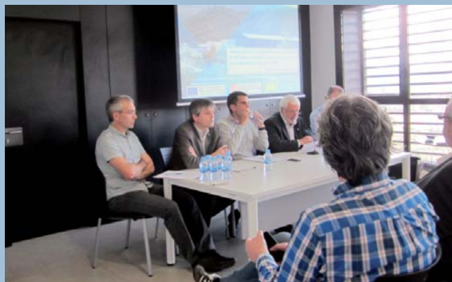
Imatge de la presentació del Pla d'impuls dels polígons industrials

Cardona, Solsona i Olius consensuaran un model de gestió conjunta dels polígons industrials a fi de dinamitzar-los i augmentar-ne l'activitat econòmica. Aquesta és la primera acció prioritària que recull el projecte d'impuls dels polígons a través de la col·laboració públicoprivada que fixa les línies estratègiques per dinamitzar el teixit empresarial i que es va presentar el passat 26 de maig a Cardona.