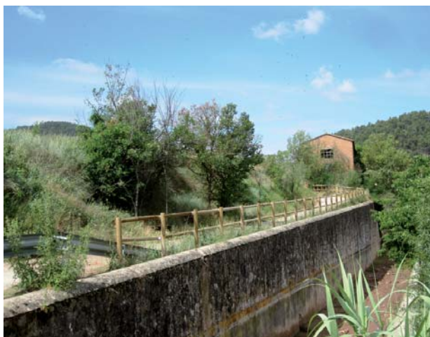
La barana del canal de la Coromina millora la seguretat de la zona

L'Ajuntament de Cardona ha instal·lat una nova barana de fusta tractada per protegir i delimitar el canal de la Coromina, des del principi del carrer de la Mel i fins al final del canal. La instal·lació d'aquesta barana és una actuació llargament reivindicada pels veïns de la Coromina i l'ha dut a terme la brigada municipal d'obres. Amb aquesta actuació es millora substancialment la seguretat d'aquesta zona i s'favoreix el seu valor paisatgístic.