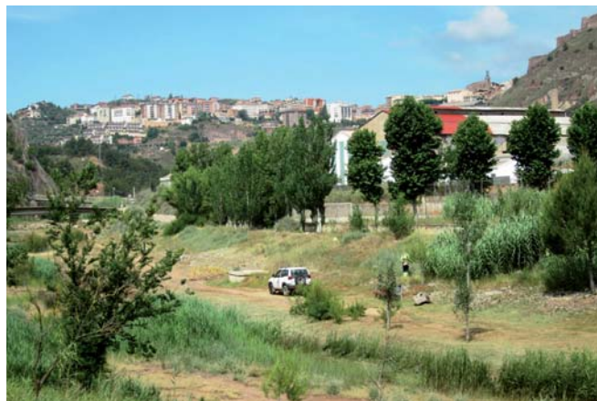
L'Ajuntament considera prioritària la millora de la llera del Cardener a la Coromina

L'acord preveu que la Generalitat i l'empresa minera aportin els 100.000 euros necessaris per dur a terme els treballs de recuperació d'aquest tram del riu Cardener. El projecte executiu ja està redactat i contempla la impermeabilització de la llera del riu des de la resclosa situada aigües avall del pont de Santa Bàrbara fins al pont del Rieral, per on circula la carretera C-1410-z, la construcció d'un petit llac d'aigua, l'adequació del canal de la Coromina i els treballs de reforestació de l'entorn. Totes les actuacions s'han consensuat amb l'Associació de Veïns i el regants de la Coromina