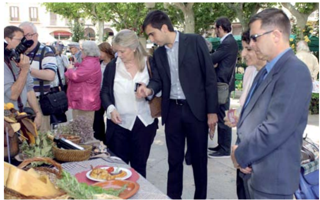
Els Sabors de 1714 es van poder tastar al passeig de la Fira

Tots aquests restaurants han inclòs a les seves cartes una mostra dels plats que es podien trobar a les taules catalanes del segle XVIII.