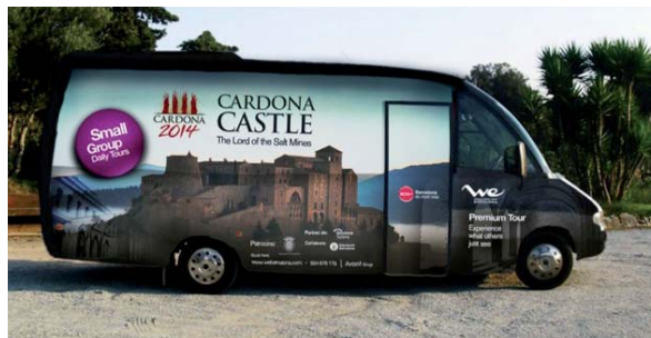
Imatge del bus promocional de les visites a Cardona

de comunicació turístics de referència i a les plataformes digitals i d'Internet amb més usuaris i es comercialitzarà la visita a la vila entre les empreses de gestió de creuers. El Pla de màrqueting estableix una sèrie d'accions concretes a desenvolupar aquest 2014, més d'un 50% de les quals ja s'han posat en marxa, com la creació d'una excursió a la vila ducal tres cops per setmana des de Barcelona amb la possibilitat que sigui diària en el període estival o el disseny de nous fulletons de la vila. També s'està fent una ferma aposta per la promoció i amb aquest motiu Cardona ha estat present a les fires més importants de Turisme, entre elles FITUR i el Saló Internacional de Turisme de Catalunya, amb un estand propi en el qual hi havia representats també els agents turístics privats del municipi, per tal d'obrir Cardona a nous mercats. A més, s'està treballant per aconseguir el segell de destinació familiar. Totes les activitats previstes estan pensades per augmentar el nombre de visitants i els recursos que genera el turisme a la vila.