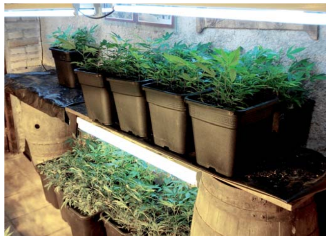
Imatge d'algunes de les plantes incautades en l'operació policial

La descoberta va ser possible gràcies a l'actuació de dos agents de la Policia local de Cardona que feien la ronda habitual de seguretat pel municipi. A més de les plantes, les dependències de l'immoble estaven equipades amb un sistema de reg amb circuit electrònic d'aigua, ventilació i enllumenat fix. L'alcalde de Cardona, Ferran Estruch, i el tinent d'alcalde, Josep Tristany, han felicitat la Policia local de Cardona per la seva professionalitat i han agraït la col·la-