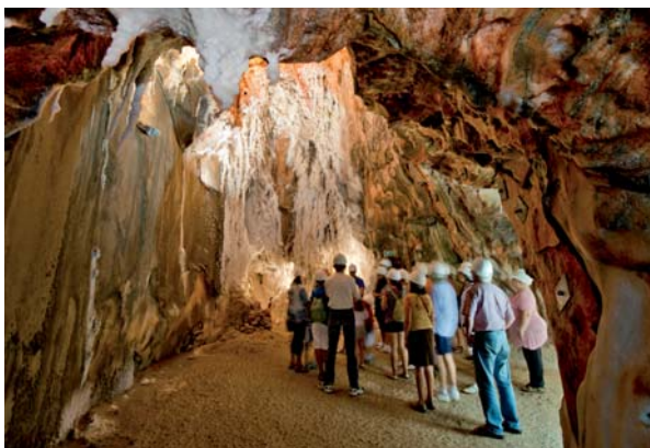
Un grup de visitants a l'interior de la Muntanya de Sal

Cardona va tancar una molt bona Setmana Santa pel que fa a l'activitat turística al municipi i a les xifres d'ocupació dels centres turístics de la vila. El Parc Cultural de la Muntanya de Sal, el Centre Cardona Medieval i el castell han registrat, del 12 al 21 d'abril, un total de 6.151 visitants, una xifra que suposa un increment de 912 respecte al 2013 i de 2.379 respecte al 2012. Per als responsables de turisme del