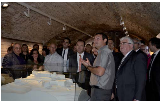
La comitiva d'autoritats va visitar la museïtzació de la casamata i va seguir les explicacions dels tècnics que han restaurat els baluards del castell