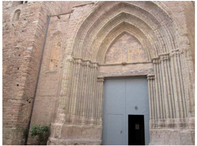
Façana de l'església de Sant Miquel

El projecte de restauració de la façana del temple de Sant Miquel contempla una segona fase consistent en el recobriments de la part superior dels arcs de la portalada, la neteja de les parets superiors i el sanejament de la coberta de la façana del Mercat, que espera una subvenció de la Diputació de Barcelona per executar-se.