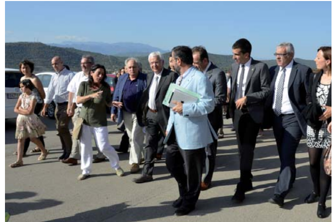
Cardona ha aconseguit renovar el conjunt arquitectònic del castell de Cardona

El castell de Cardona aconsegueix obtenir entre els anys 2013 i 2014 una inversió de prop d'1,5 milions d'euros