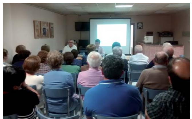
L'equip de govern també va presentar el balanç dels tres primers anys de mandat als veïns de la Coromina