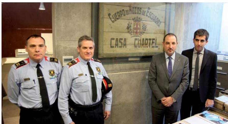
L'alcalde de Cardona i el conseller d'Interior davant el cartell de l'antiga caserna dels Mossos d'Esquadra

La presència dels Mossos d'Esquadra a Cardona es remunta a l'any 1719, data de fundació del cos. Aleshores s'hi va establir l'esquadra més antiga del cos. Acabada la Guerra Civil, les autoritats