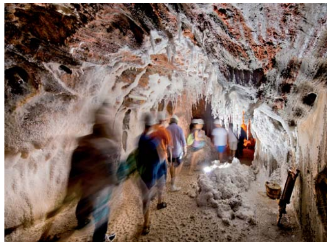
L'activitat turística continua sent un dels principals eixos de la política econòmica de Cardona