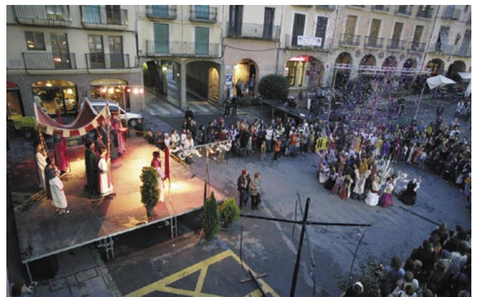
Fira Medieval 2011

L'Ajuntament i la Comissió de Fira han apostat per reforçar la presència del comerç local a la Fira, dinamitzant i ampliant els espectacles i les activitats de carrer. Amb aquest enfocament es vol potenciar el retorn econòmic que la Fira pot generar per al municipi sense perdre el valor històric i patrimonial de la mostra. Així, i com a novetat d'enguany, s'estudia la possibilitat d'oferir als visitants un punt específic per donar a conèixer el producte local i de proximitat de Cardona, a banda d'ampliar la participació del comerç local al certamen. La Fira Medieval/Festa de la Sal 2012 se celebrarà els propers dies 2 i 3 de juny