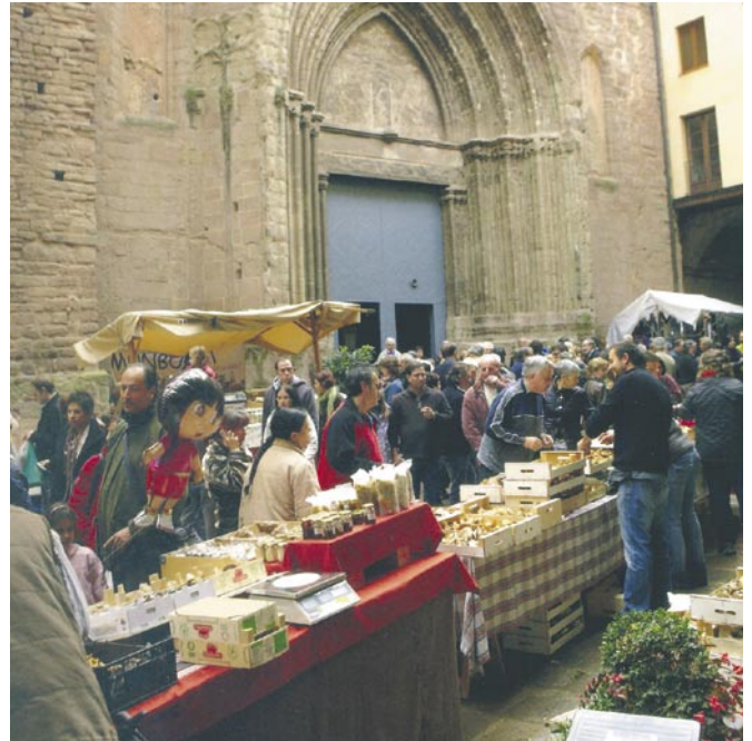
La passada edició de la Fira de la Llenega va ser de les més concorregudes dels últims anys

Un any més, la Fira va tenir un concurs de llenegues -en què es premiava la més gran i la més original- i un de conserves, a més de l'exposició de bolets organitzada per l'Agrupació Micològica Berguedana. A banda de les parades d'artesanaria, els comerços de la UBIC van treure els seus productes al carrer per ampliar l'oferta comercial del certamen i el grup Salaborr de Mar va oferir un concert d'havaneres. Els més petits també van gaudir de la Fira gràcies al concurs infantil de buscar bolets i un espectacle infantil.