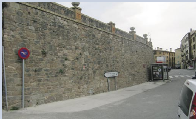
S'ha reparat el paviment a l'entorn de la parada de bus