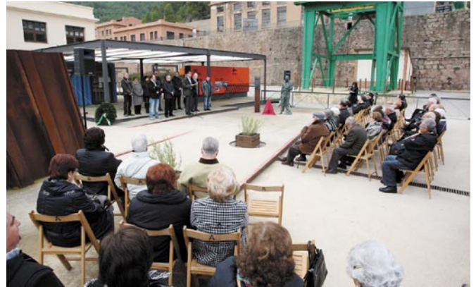
L'acte institucional de Santa Bàrbara es va celebrar davant el monument al miner de Cardona i va aplegar un gran nombre de cardonins i cardonines

La celebració va finalitzar amb una visita a l'exposició "Memòria de les Dones de les Colònies de Cardona" que s'ha instal·lat de forma permanent a la nova cafeteria del Parc Cultural de la Muntanya de Sal.