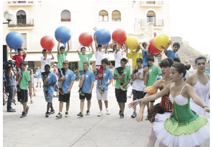
El lipdub de la salut va omplir Cardona de color i de festa

El passat mes de març es va posar en marxa la fase inicial del Programa Fifty-Fifty, impulsat per la Fundació SHE i