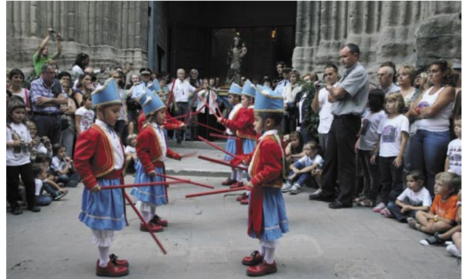
Festa Major 2011

Ajuntament i Comissió van acordar reduir la despesa, mantenint els actes centrals de la festa cardonina i potenciant-ne el vessant festiu i tradicional. Aquestes mesures van permetre reduir el pressupost en uns 30.000 euros respecte a l'edició de l'any 2010, un esforç que tant l'Ajuntament com la Comissió volen seguir mantenint de cara a la propera Festa Major