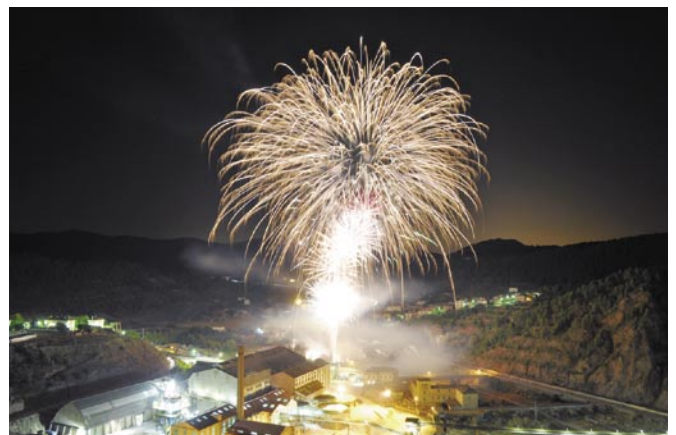
Festa Major de la Coromina 2011

Com cada any els veïns es van bolcar en la festa que s'ha convertit en un espai de retrobament entre totes aquelles persones que mantenen els vincles afectius amb la Coromina. Diumenge al matí es va celebrar el tradicional ofici solemne i es va arribar al punt culminant de la festa amb un espectacular piromusical. Enguany, la música del piromusical incloïa cançons populars dels anys 80 i 90 i va ser seguit per un gran nombre d'espectadors.