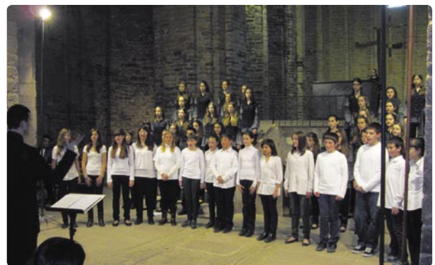
El Grup Coral de "Musicant" actuant al costat del Cor Amics de la Unió