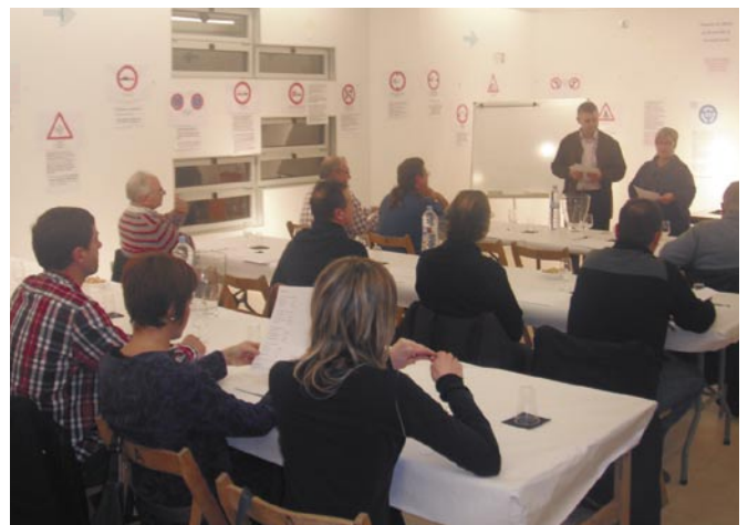
El taller de tast de vins a la sala polivalent va ser un dels més participats