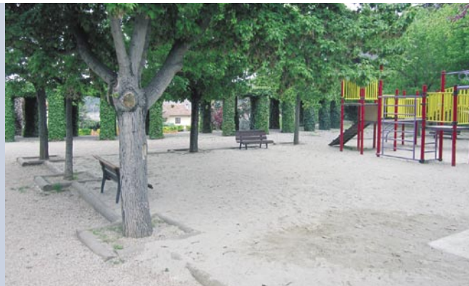
S'ha adequat el parc de la carretera del Miracle