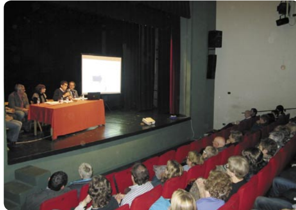
El teatre Els Catòlics va acollir la sessió pública sobre els comptes municipals

brar el dèficit del consistori i assegurar la liquiditat de la tresoreria per pagar els proveïdors. El Pla obligarà l'Ajuntament a contenir dràsticament la despesa i a establir un calendari de pagaments als proveïdors, en especial a les empreses locals, les quals acumulen retards de més de 12 mesos.