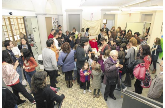
La jornada de portes obertes va aplegar un gran nombre de persones

A l'acte es va convidar els familiars de la família Escasany i un gran nombre de veïns i veïnes que van conèixer de prop les noves instal·lacions i van poder veure l'exposició