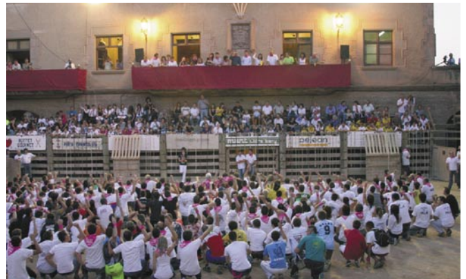
Festa Major 2011