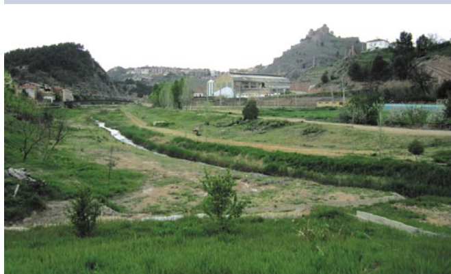
S'ha netejat la llera del riu al nucli de la Coromina