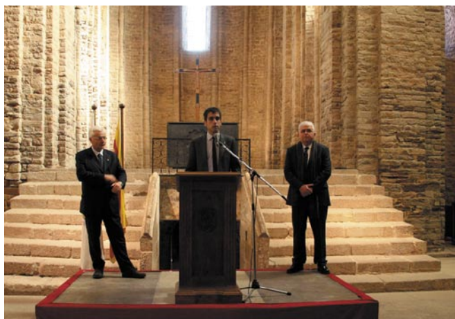
L'alcalde de Cardona durant el seu discurs acompanyat del conseller de Cultura i del director del Museu d'Història de Catalunya

escenificat del Setge de 1711, realitzat expressament per a l'ocasió. Un cop acabada la representació, es va inaugurar l'edifici de la casamata, la restauració del qual ha permès fer-lo visitable. Els actes van finalitzar amb una ofrena floral i unes salves d'honor en homenatge als defensors del castell de Cardona als peus del baluard de Sant Llorenç. El Cant dels Segadors, interpretat per la Banda de Música de Cardona, va posar punt i final a l'acte