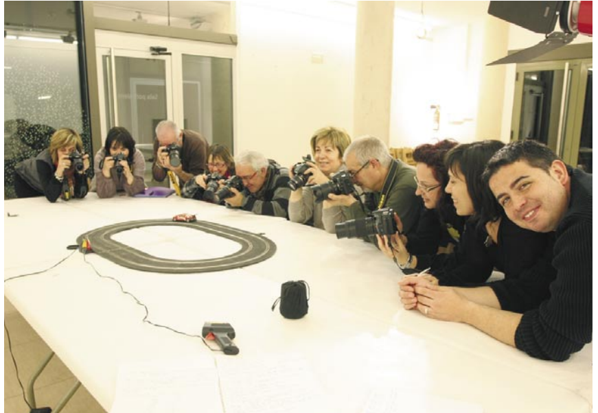
Els participants al taller de fotografia a la sala polivalent de la Biblioteca municipal

El primer bloc d'activitats va constar d'un total de 6 activitats: un curs introductori a la fotografia digital, un taller de restauració de mobles i objectes antics, un curs d'elaboració de pastissos, un taller d'iniciació al tast de vins, un de patchwork creatiu i un de gralla. El segon bloc d'"el taller" inclou 9 tallers relacionats amb el món de la cuina, l'artesanía, la història o la fotografia. Les activitats s'han dut a terme en diferents espais de la vila com les Escoles Escasany, l'escola Mare de Déu del Carme, l'escola Joan de Palà o la sala polivalent de la Biblioteca.