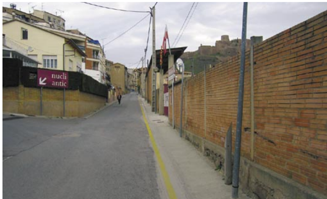
S'ha reposat la vorera de la carretera de la Mina a l'altura del camp de futbol municipal