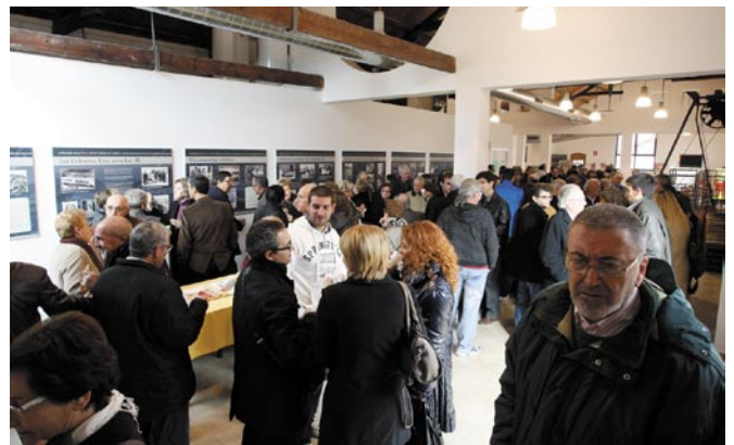
La nova cafeteria del Parc Cultural de la Muntanya de Sal acull l'exposició permanent dedicada a les dones de les colònies de Cardona