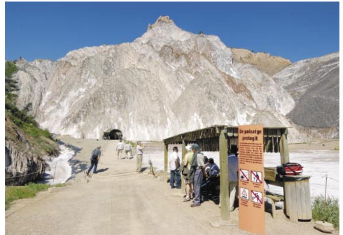
Imatge de l'accés dels visitants a la Mina Nieves, al Parc Cultural de la Muntanya de Sal de Cardona

A banda de la figura de membre de la Fundació, també es potenciaran les figures de membre col.laborador i mem-