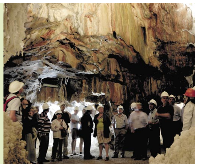
Un grup de visitants contemplant l'interior de la Muntanya de Sal de Cardona

Per altra banda, durant l'any 2011 la FCH va impulsar diverses activitats destinades a fomentar la promoció i difusió del patrimoni cardoní amb un total de 3.724 visitants.