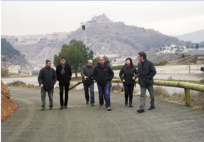
L'alcalde de Cardona i la regidora de la Coromina visiten les obres del camí de Bolsegura amb els tècnics del Consell

El projecte, redactat i executat pel Consell, va servir per anivellar el ferm, reforçar talussos i eixamplar diversos trams del camí. Les obres es van excutar en el termini de tres setmanes sobre els 3,5 quilometres de camí que van de l'estació de servei de la Coromina fins a Bolsegura. L'actuació ha suposat una inversió de 60.467 euros que han finançat el Consell (56.524 euros) i l'Ajuntament (3.943 euros). A més es van instal·lar 52 metres de tanca protectora i la senyalització viària corresponent.