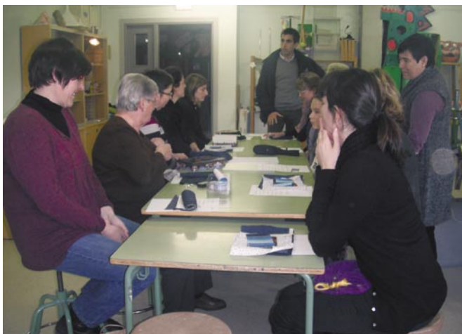
Imatge del taller de patchwork realitzat a l'escola Joan de Palà de la Coromina

que evidencia la bona acollida que ha tingut la iniciativa. Així, al primer bloc d'"el taller" s'hi van apuntar un total de 85 persones, mentre que en el segon la xifra ha augmentat fins a les 123 persones apuntades.