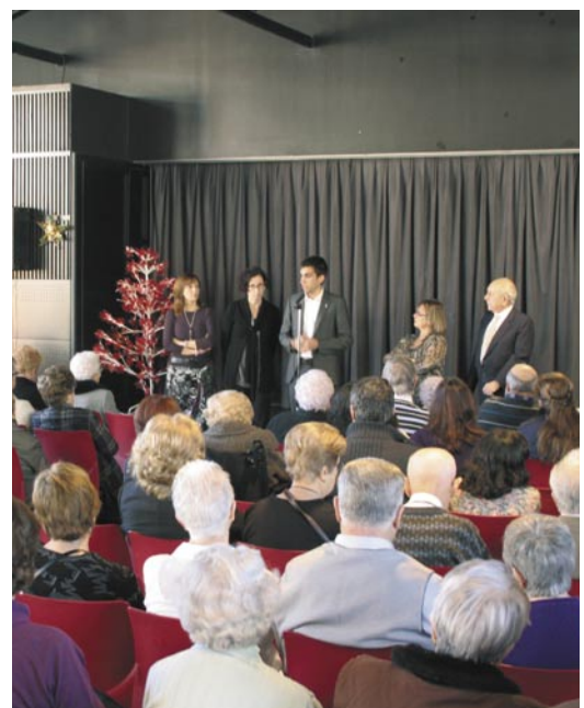
El Casal de la Gent Gran de Cardona es va omplir per celebrar la festa d'homenatge a les àvies i avis de 90 anys

La jornada va comptar amb les actuacions del grup d'havaneres Salaborr de Mar, de la Faràndula i la Coral l'Amistat. Les àvies i els avis homenatjats van ser obsequiats amb un petit record i, finalment, es va oferir un pisco-labis per a tots els convidats