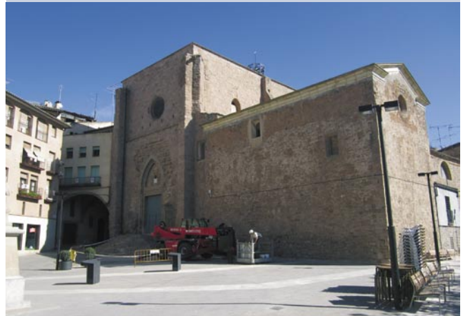
Les obres a la coberta de l'església de Sant Miquel han permès solucionar els problemes de filtracions d'aigua

L'execució de les obres, que van tenir un pressupost de 20.000 euros, va ser possible gràcies al conveni de col·laboració signat entre l'Ajuntament de Cardona, la parròquia i la Diputació de Barcelona. L'organisme provincial es va fer càrrec del total dels costos de l'obra segons s'estipulava en el conveni signat entre les tres parts.