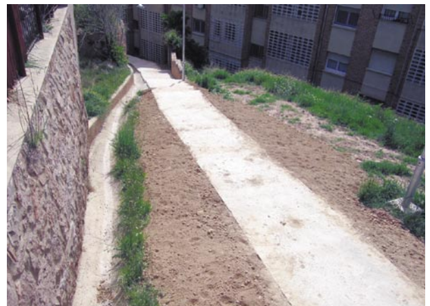
Imatge del camí d'accés a la plaça de les Escoles Escasany

Les obres han consistit en la superposició d'una llosa de formigó que, a més d'anivellar el ferm, evitarà l'acumulació de pedres i terres al camí. El tram pavimentat té uns 30 metres de longitud per 1'5 d'amplada, amb alguns esgalons en la part més inclinada. L'actuació forma part de les millores incloses en el Projecte de restauració de les Escoles Escasany.