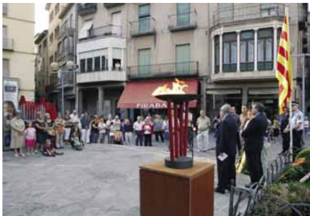
Un moment de l'acte del 10 de setembre

"...Catalunya, en el transcurs de la seva història, no ho ha tingut mai fàcil, però el nostre temps és especialment difícil. La capacitat actual de soscar la cohesió i la unitat del nostre poble, que tenen els enemics d'una Catalunya en plenitud, té mil formes. Tenim una sentència del Tribunal Constitucional que penja, com una espasa de Dàmocles, sobre la dignitat i el respecte del nostre país. És clar que s'han de complir les lleis i s'han d'acatar les sentències, però s'han de complir totes les lleis, inclosos els principis que inspiren el pacte social, democràticament establert, que regeix la convivència bàsica de qualsevol poble. La lleialtat, la lleialtat autèntica, és sempre recíproca. Per tant, la nostra reacció ha de ser la unitat i la solidaritat.