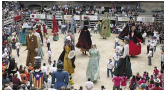
La Trobada de Gegants va omplir de públic la plaça de la Fira, dissabte a la tarda