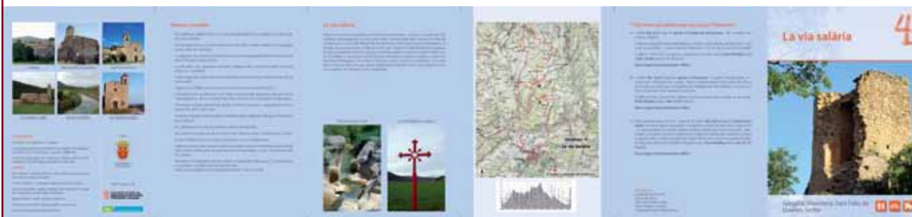
Les guies incorporen tot tipus d'informació: imatges, plànols i descripcions dels llocs assenyalats

El projecte incorpora, a més, les últimes tecnologies de la informació ja que cada ruta també es pot consultar en format digital i permet a l'usuari descarregar-se la informació a través de l'ordinador o del GPS. La guia “Cardona: els camins de la nostra història” es pot adquirir a les llibreries de Cardona. Cada ruta es pot comprar per 2 euros mentre que el pack amb tots 8 itineraris inclosos es comercialitza pel preu de 10 euros.