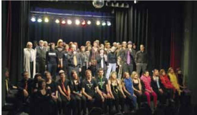
A dalt, final de l'obra "50logia", amb tots els actors a l'escenari, a sota escena de "Don Juan Tenorio"

Per altra banda, el dissabte 21 de novembre El Traspunt va presentar l'obra "50logia", un recull d'algunes de les obres més destacades que el grup ha representat al llarg