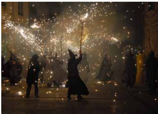
Imatge del cartell i el correfoc de la Festa Major de la Coromina 2009