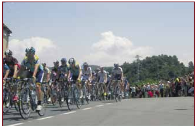
Els corredors arribant a Cardona