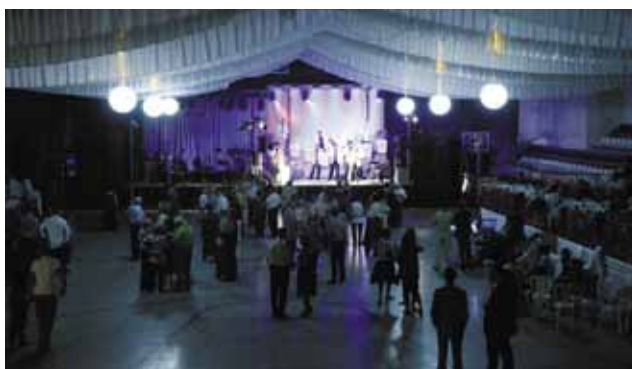
L'envelat es va omplir dilluns a la nit per gaudir del ball de gala amb les orquestres Amoga i la Banda del Drac