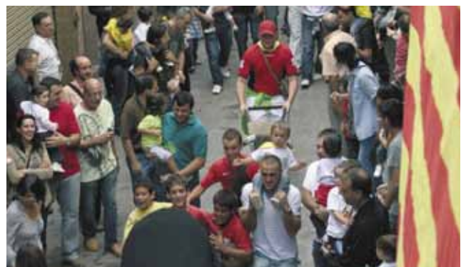
L'Encierro i el Corre de Bou infantil mantenen l'èxit de participació dels altres anys