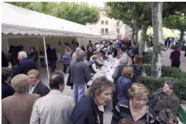
Els carrers i places de Cardona es van omplir de visitants