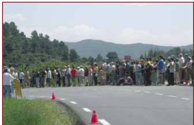
Els cardonins no es van voler perdre l'històric pas del Tour per Cardona