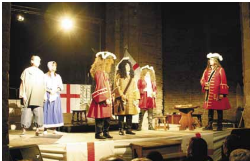
Les representacions de l'obra "7 dies de setembre" va tenir una molt bona acollida del públic

Els actes van començar el 18 de setembre amb l'ofrena floral, lectura del ma-