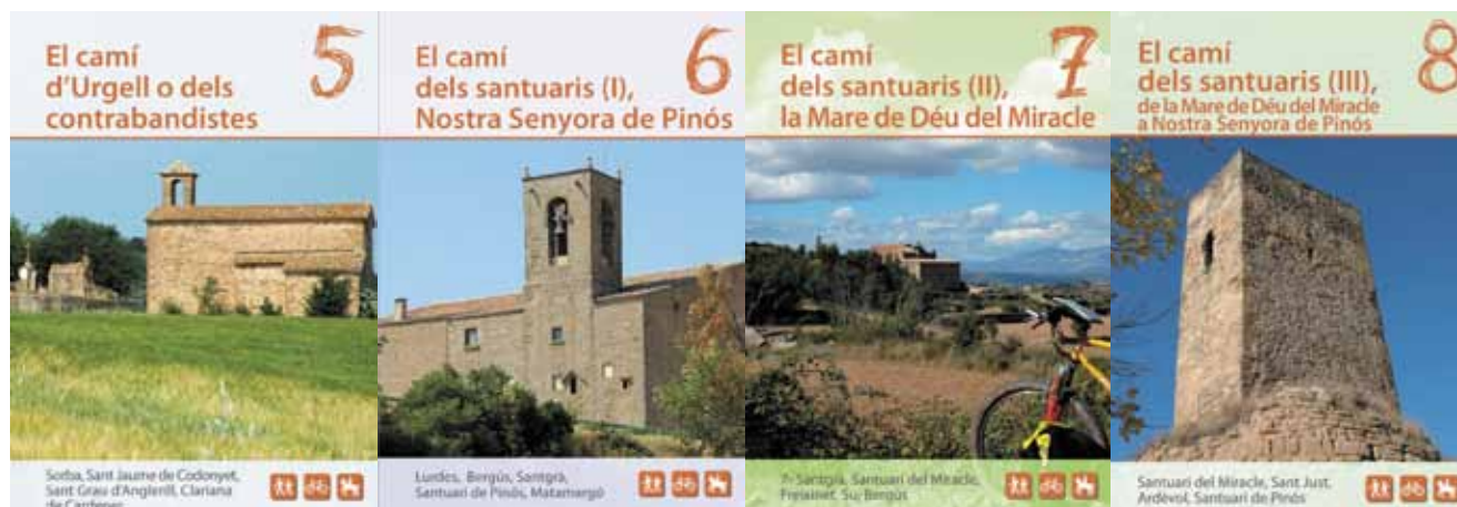
Portada de les guies dels itineraris naturals