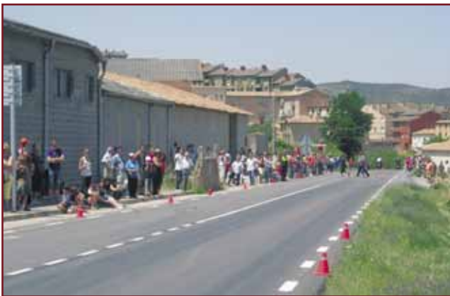
Un públic nombrós va seguir l'edeveniment

l'operatiu format per voluntaris de Protecció Civil, de la Penya Ciclista Mundo i de veïns de la vila, a més de la Policia Local i la Brigada Municipal. L'Ajuntament agraeix la col.laboració de les persones que van participar en el dispositiu de control i felicita la ciutadania pel seu exemplar comportament durant el pas de la cursa per Cardona