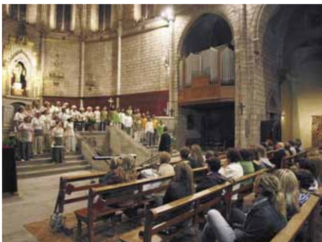
Concert del grup Esclat Gospel Singers a l'església parroquial