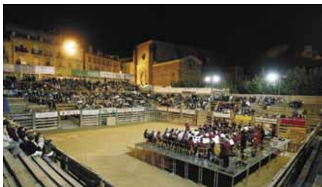
Concert de la Banda de Cardona dimarts a la nit a la plaça de la Fira i amb les grades plenes