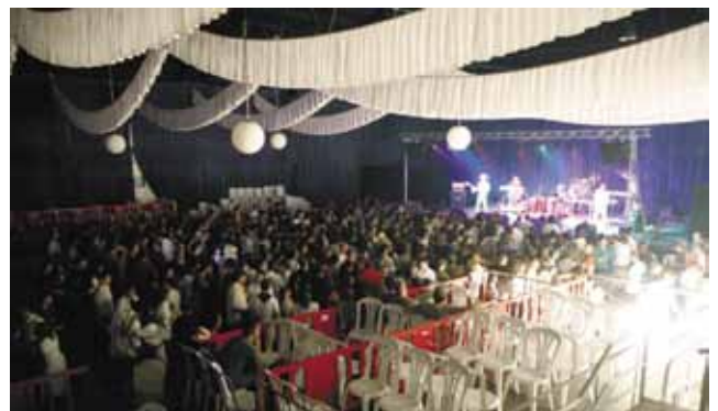
El pavelló va acollir el sopar-concert de DFT-Mikonio amb les actuacions de Los Pachucos i La Loca Histeria