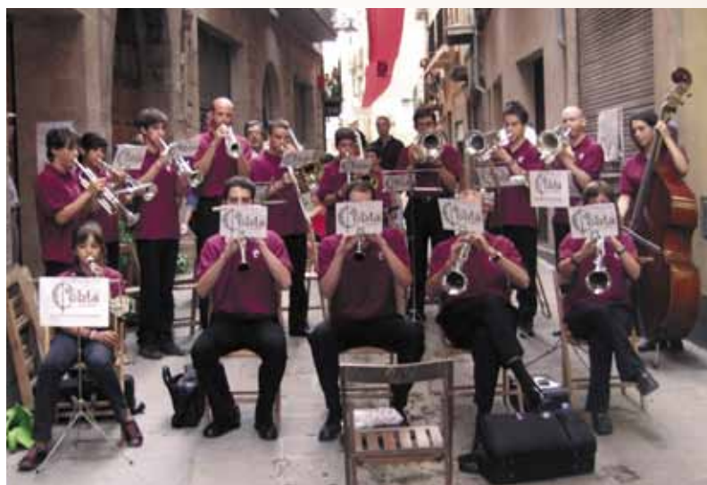
La Cobla Cardona en una de les seves actuacions a la vila

Jo crec que és important perquè la gent que té interès i inquietuds per la música pugui disposar d'una altra plataforma per aprendre i gaudir de la música. Crec que és molt bo que sorgeixin iniciatives com la Cobla Cardona o, en el seu moment, la Banda de Cardona, perquè contribueixen a dinamitzar l'activitat musical de Cardona i són un complement fonamental per la formació dels músics.