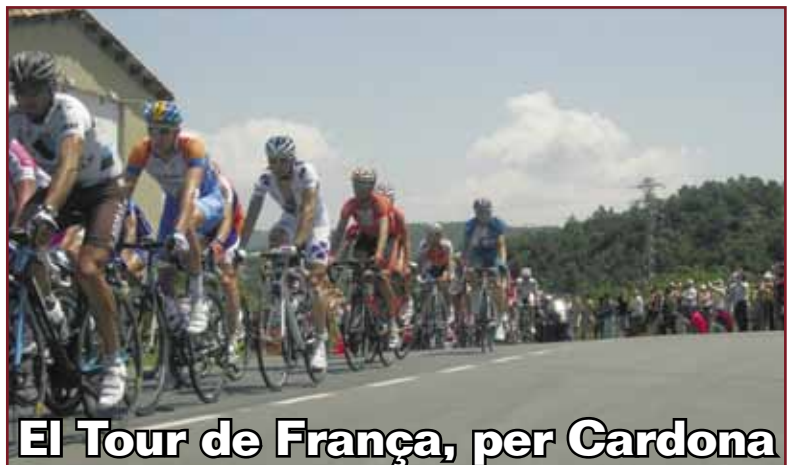
El Tour de França, per Cardona