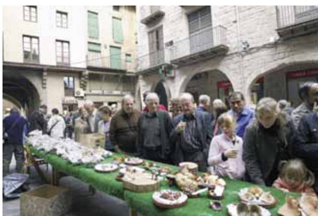
La mostra de bolets va ser molt visitada