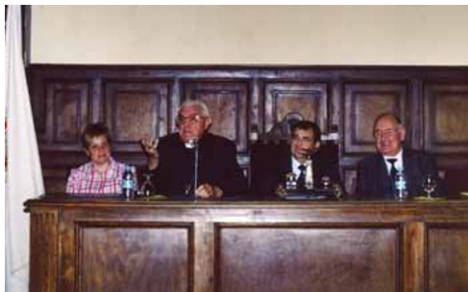
Imatge d'arxiu de l'acte d'homenatge al Bisbe Guix celebrat a Cardona l'any 2003

Precisament per la Festa Major de 2003, l'Ajuntament de Cardona va homenatjar el Dr. Guix en reconeixement a la seva trajectòria. El bisbe Guix va morir el passat 28 de juny a l'edat de 81 anys.