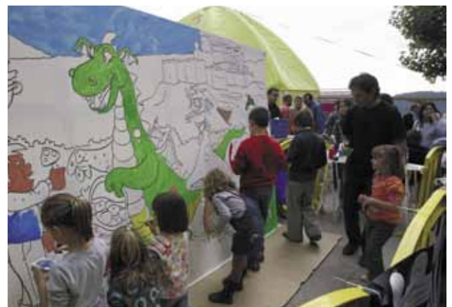
Els més petits també van poder gaudir de la Fira de la Llenega