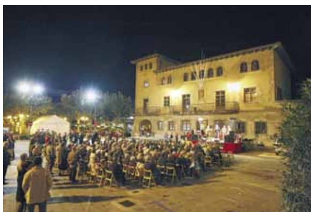
La Fira de Baix va acollir l'actuació del grup Rems d'havaneres i la cerimònia d'entrega de premis dels diferents concursos de la Fira