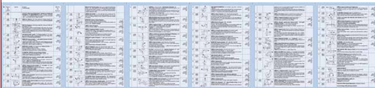
Cada itinerari disposa d'una detallada guia de la ruta a seguir