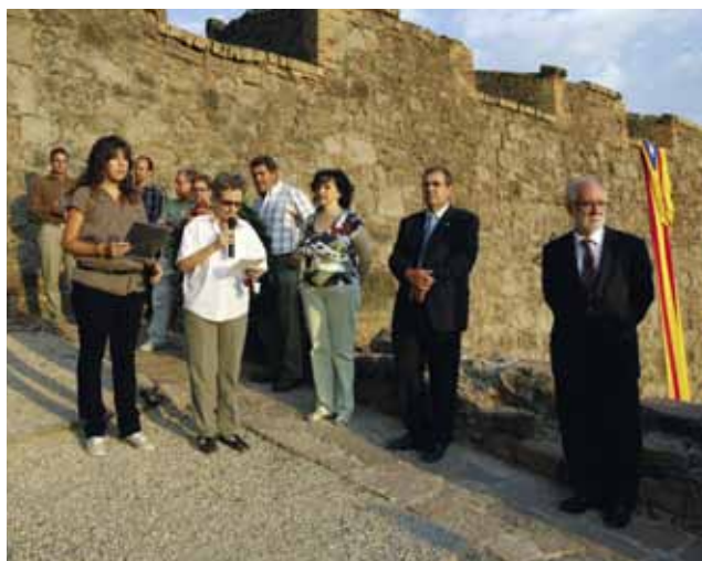
Ofrena floral i lectura del manifest al baluard de Sant Llorenç

nisme polític, i estem aconseguint que molt bona part de cardonins el coneguin, i que les institucions i el món acadèmic descobreixin o resituïn Cardona, probablement encara no en el lloc que li correspon, però sí que hem avançat molt. En aquests moments és impensable escriure un llibre amb rigor històric sobre el nacionalisme català, sobre la guerra de Successió, sense explicar el paper cabdal de Cardona i els defensors del castell, per exemple.