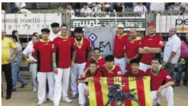
Els membres de la Penya El Calaixó a la plaça de bous de Cardona