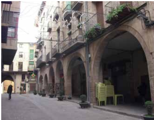
Imatges del carrer Escasany i la plaça Mercat al nucli antic

Així, a les quanties que els puguin correspondre en aplicació del Decret 455/2004, s'hi afegeix un 10% més