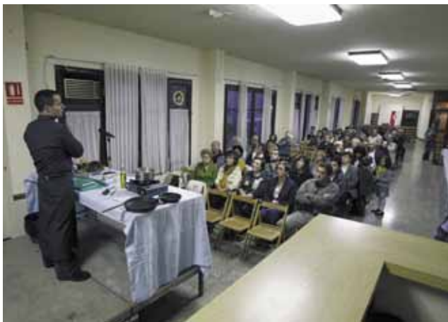
Imatge de la demostració de cuina amb bolets a càrrec dels professors i alumnes de l'Escola d'Hostaleria Joviat

A més, durant el matí de diumenge els visitants van poder realitzar tot tipus d'activitats com: degustar diversos plats cuinats amb llenegues i elaborats pels restaurants del municipi o contemplar l'exposició de diferents varietats de bolets del país, realitzada per l'Agrupació Micològica Berguedana. Com ja és tradicional, la Fira va comptar també amb els concursos de conserves, de la llenega més gran i del bolet més original. La Unió de Botiguers i Comerciants de Cardona es va sumar a la festa sorteiant quatre packs entre els seus clients per un import de 100 euros cadascun.