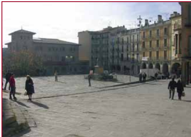
La Fira de Dalt lliure de vehicles

Des del passat mes de juny funciona una oficina específica en què s'informa de les condicions d'ús i es tramiten les sol·licituds per obtenir les targetes. L'horari de l'oficina