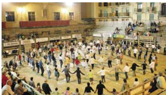
Audició de sardanes amb l'orquestra Amoga a la plaça de la Fira