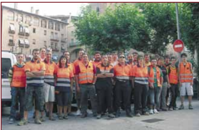
Una trentena de voluntaris van formar l'operatiu de control del Tour