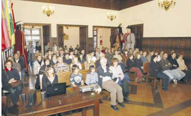
La presentació de les rutes va omplir de públic el saló de sessions de l'Ajuntament