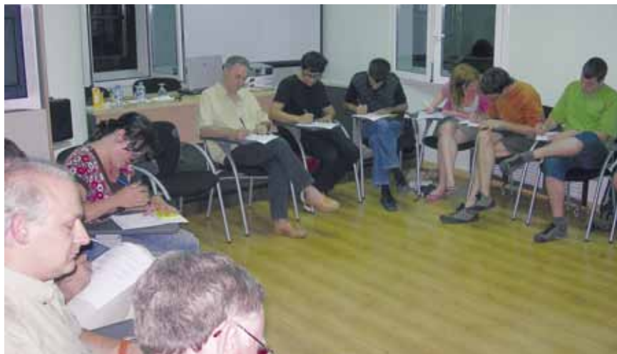
Imatge d'arxiu del procés de participació entorn al projecte de renovació de la Fira de Dalt

La proposta guanyadora va ser valorada per una part dels assistents a la reunió, al·legant que calia augmentar la vegetació, el mobiliari urbà havia d'estar en consonància amb el nucli antic, recuperar l'antic dipòsit