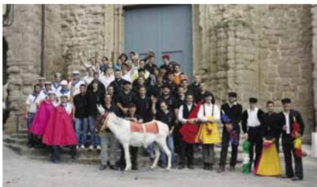
Foto de grup dels participants al Festival còmic taurí en benefici de la residència de la tercera edat Sant Jaume