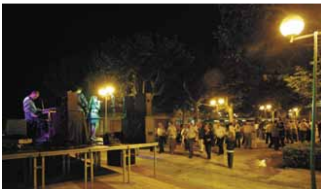
La Fira de baix va ballar animadament amb l'actuació de Montse i Joe Transfer