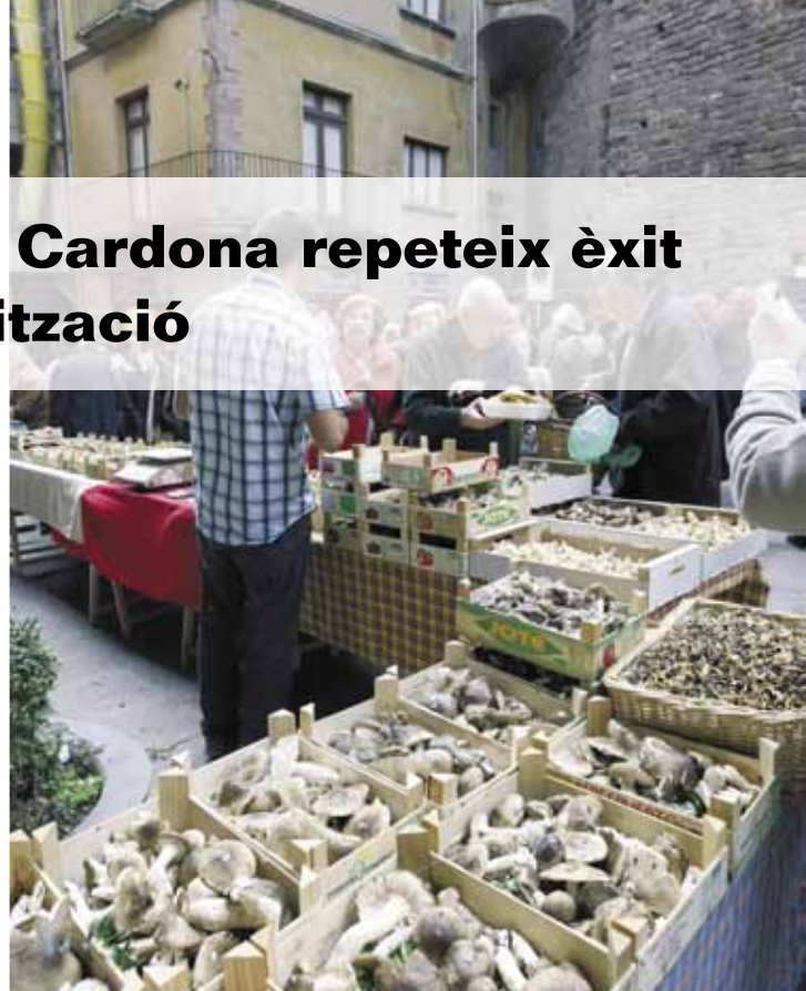
La Fira de la Llenega 2009 va augmentar el nombre d'expositors i visitants

La mostra va arrencar dissabte amb una demostració i degustació de la cuina de la llenega a càrrec de l'Escola d'Hostaleria Joviat i un taller de titelles infantils a la plaça de la Fira. La jornada es va tancar amb l'actuació