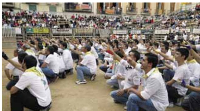
Una imatge tradicional de la Festa Major i el Corre de Bou de Cardona