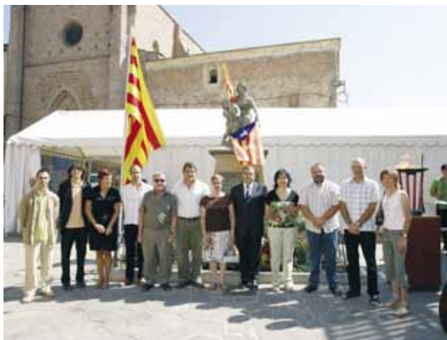
Els membres del consistori davant el monument de l'11 de setembre

Des de l'Ajuntament hem fet un gran esforç d'investigació, recuperació i divulgació del nostre passat lligat al catala-