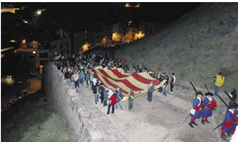
Imatge de la pujada al castell de Cardona

nifest, cant dels Segadors i encesa del peveter al monument commemoratiu del 1714, seguidament es va pujar al castell on va començar la recreació històrica "7 dies de setembre".