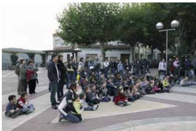
Animació infantil a la Fira de Baix