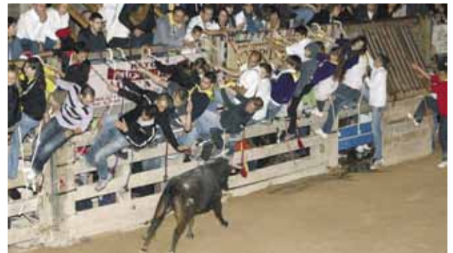
El Corre de Bou de dissabte va ser seguit per un públic nombrós tot i la pluja que va caure a l'inici de l'acte