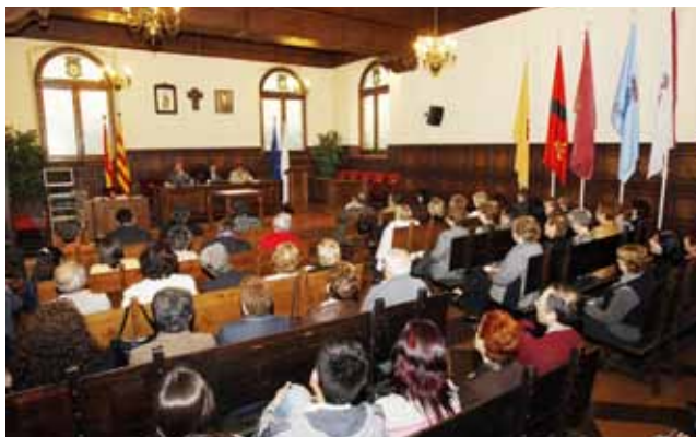
La presentació del llibre va omplir a vessar el saló de sessions de l'Ajuntament

El llibre, del qual se n'han fet una tirada inicial de 1.000 exemplars, es pot adquirir a les llibreries de Cardona al preu de 12 euros i es va presentar el passat 29 d'abril en