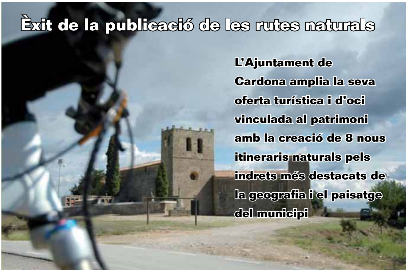
El monestir de Santa Maria de Serrateix

L'Ajuntament de Cardona amplia la seva oferta turística i d'oci vinculada al patrimoni amb la creació de 8 nous itineraris naturals pels indrets més destacats de la geografia i el paisatge del municipi