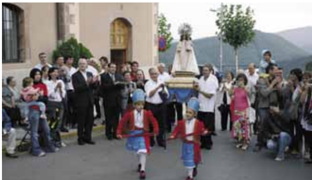
Els nens del Ball de Bastons i la Banda de Cardona acompanyen la Mare de Déu del Patrocini