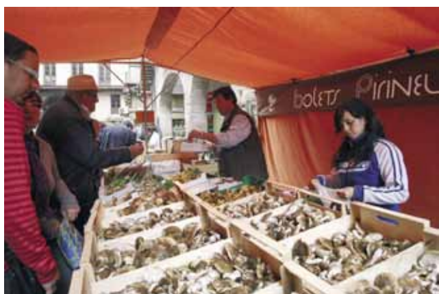
Les parades de bolets, protagonistes de la Fira