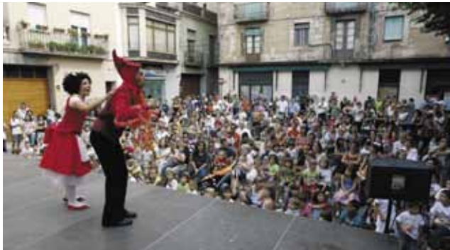
Els més petits van gaudir de l'espectacle el Zoo d'en Pitus, a la plaça del Vall el dissabte al matí