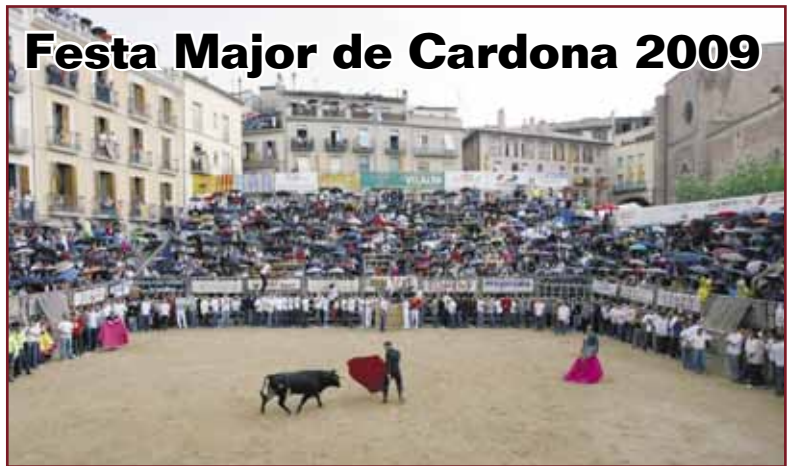
Festa Major de Cardona 2009

El grup de teatre el Traspunt celebra els 50 anys d'història amb un any ple de celebracions