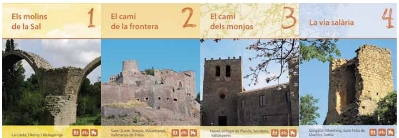
Portada de les guies dels itineraris naturals