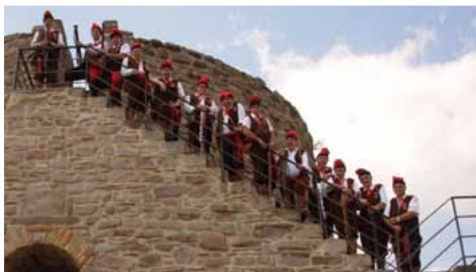
Els Trabucaires de Sant Ramon a la Torre de la Minyona

que, com és tradició, va tenir l'actuació dels Trabucaires de Sant Ramon que enguany celebraven el seu 25è aniversari. Els actes van començar a les 11 del matí amb una missa solemne a la col·legiata de Sant Vicenç i la cantada dels goigs a càrrec de la Coral Cardonina. A la tarda es va organitzar un concert a càrrec de “Simpàtic Quintet”. Una ballada de sardanes al pati Ducal amb la Cobla de Cardona va cloure els actes de celebració.