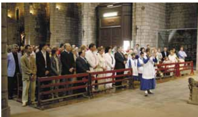
Celebració Eucarística en honor del Sant Nom de Maria, a l'església parroquial de Cardona