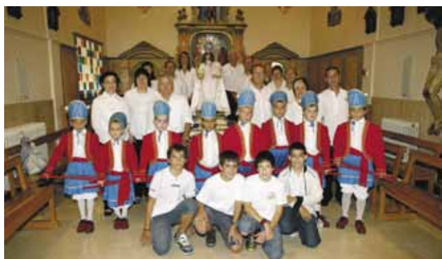
El Ball de Bastons va acompanyar la imatge la Mare de Déu petita a la capella de l'Hospital