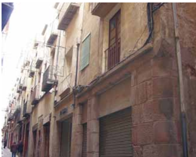
Façana de la finca que es rehabilitarà al carrer Escasany

Les previsions municipals, degudament contrastades amb els responsables de Medi Ambient i Habitatge, són construir el que la futura norma en denomina allotjaments, perquè són inferiors a 40 metres quadrats i estan pensats per a gent gran que viu sola. També hi haurà allotjaments adaptats per acollir persones amb mobilitat reduïda. Aquests apartaments tenen un seguit de serveis comuns: sala d'estar, sala de rehabilitació,