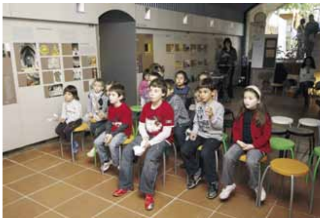
La Fira va programar actes per a totes les edats