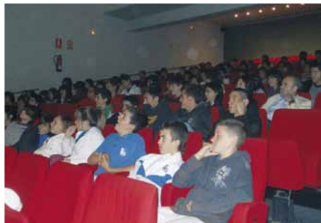
Representació de l'obra teatral "No em ratllis" entre els alumnes d'ESO i Batxillerat de l'escola Mare de Déu del Carme i de l'IES Sant Ramon

Els qui prenen alguns medicaments o que pateixen determinades malalties (el metge te n'informarà).