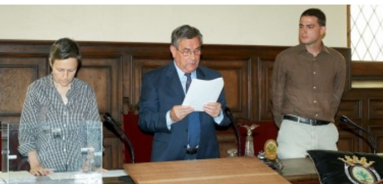
Mesa d'edat: secretària municipal, regidor de més edat i regidor més jove.

Tot seguit, va destacar els principals reptes per al nou mandat: la rehabilitació i revitalització del nucli antic, el nou Pla d'ordenació urbanística municipal, els projectes per a tots els nuclis i barris, els preparatius per a la celebració del 2014, la recuperació de la Vall Salina i la creació del nou centre cívic-casal de joves, i va animar a tots els regidors a treballar de forma conjunta “Ja des d'ara, ofereixo, als regidors que no seran al Govern, diàleg i consens com a norma de conducta, sobretot pensant en els grans temes que Cardona ha de decidir en l'immediat futur. I demano la mateixa disposició al diàleg i al consens que ofereixo”. L'alcalde va tenir un record i l'agraïment per a tots aquells que l'havien ajudat a tirar endavant el gran projecte de fer avançar Cardona i va acabar dient “I davant d'aquesta Carta de Poblament de Cardona, orgull del nostre poble, rendeixo homenatge als nostres avantpassats que varen lluitar per fer avançar Cardona; començant pels meus pares, que em varen infondre els valors del servei públic”.