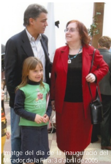
Imatge del dia de la inauguració del Mirador de la Fira: 3 d'abril de 2005.