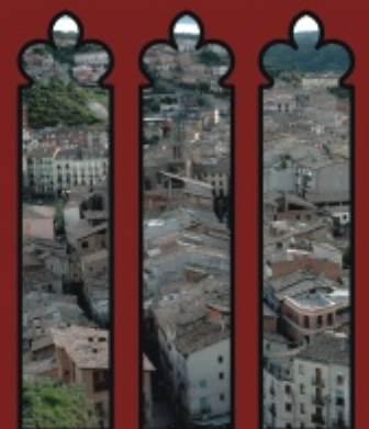
projecte d'intervenció integral del nucli antic de cardenera

L'Ajuntament valora positivament l'important nombre de peticions i espera que continuï en la propera convocatòria, que està previst obrir-la el 2008 i que serà sense terminis tancats, de manera que es podrà sol·licitar l'ajut en el moment que s'obtingui la llicència d'obres. D'aquesta manera, sumant iniciativa pública i privada, s'aconseguirà rehabilitar el nucli antic, un dels més valuosos des del punt de vista patrimonial que té el nostre país. Tots els esforços valen la pena.